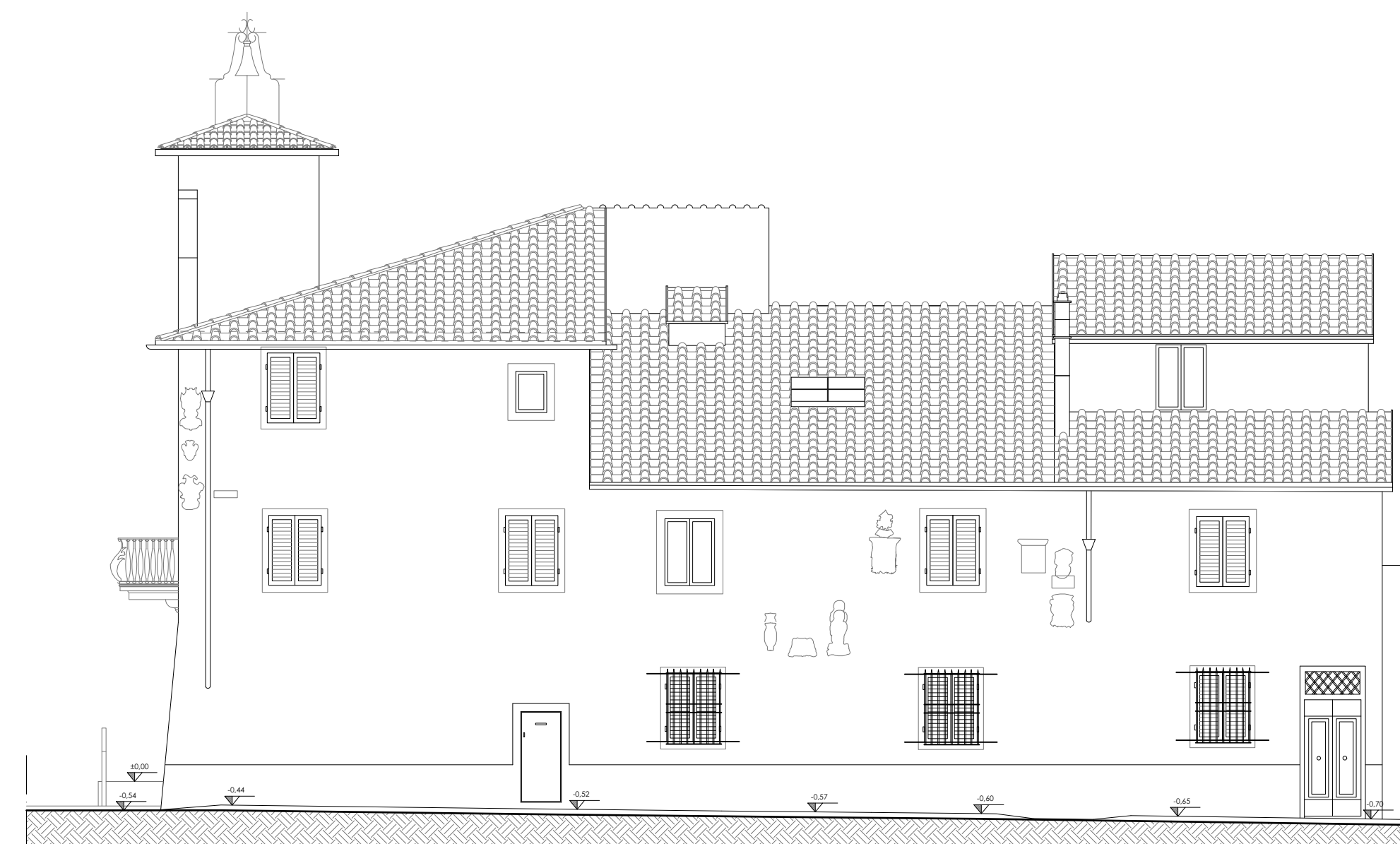
STATO ATTUALE - PROSPETTO SUD-OVEST SCALA 1:100