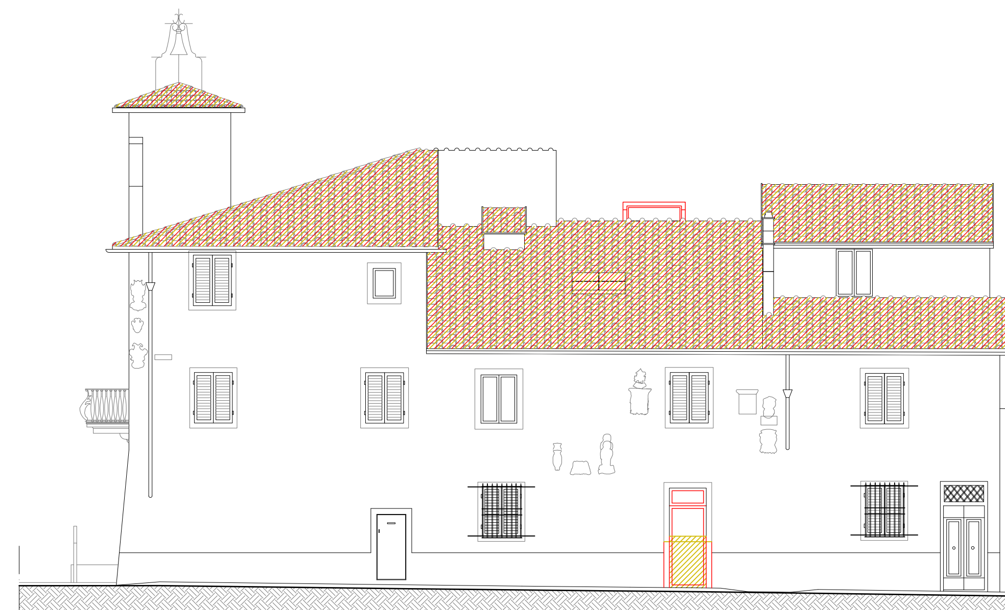
STATO SOVRAPPOSTO - PROSPETTO SUD-OVEST SCALA 1:100