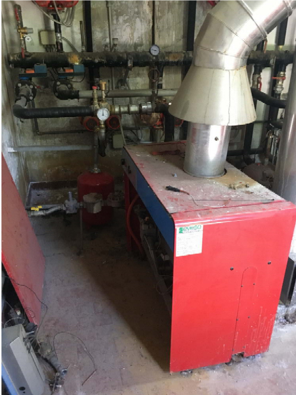
Foto del Generatore e sicurezze Cantiere Nuovo