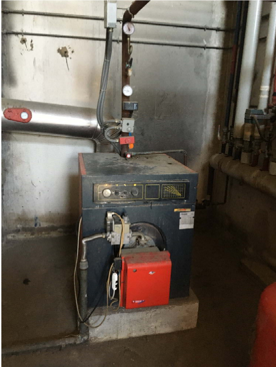
Foto del Generatore e sicurezze Cantiere Vecchio