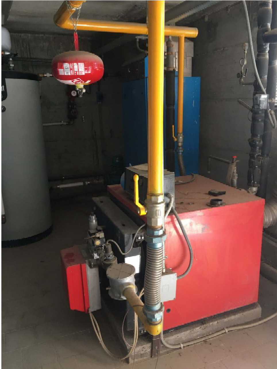
Foto dei Generatori stadio Zapotek