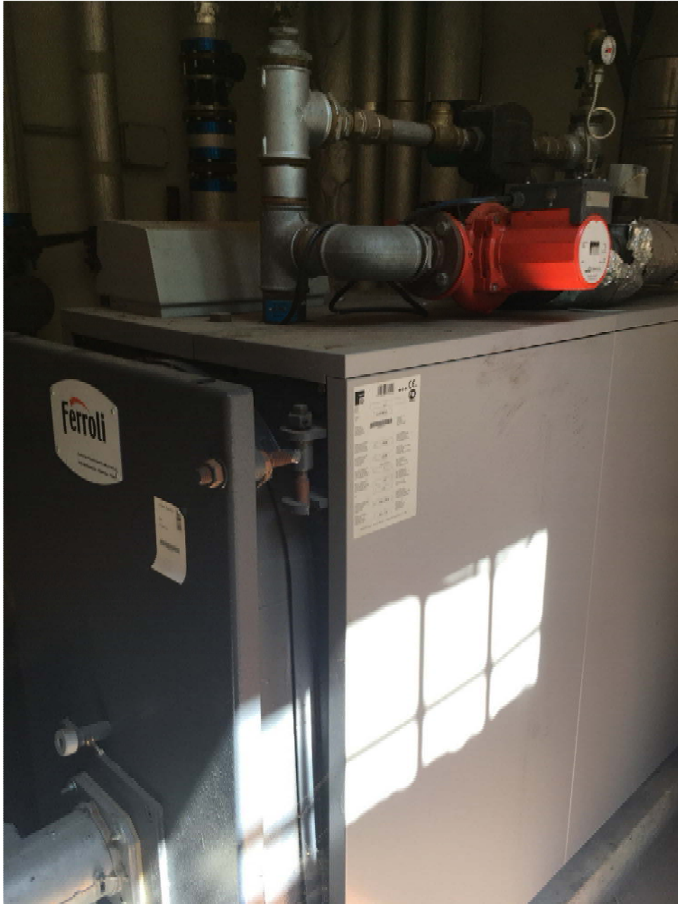
Foto Generatore Villa Montalvo