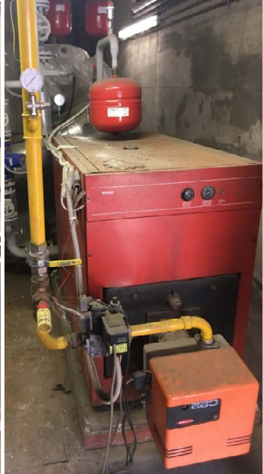
Foto dei Generatori Palazzo Comunale