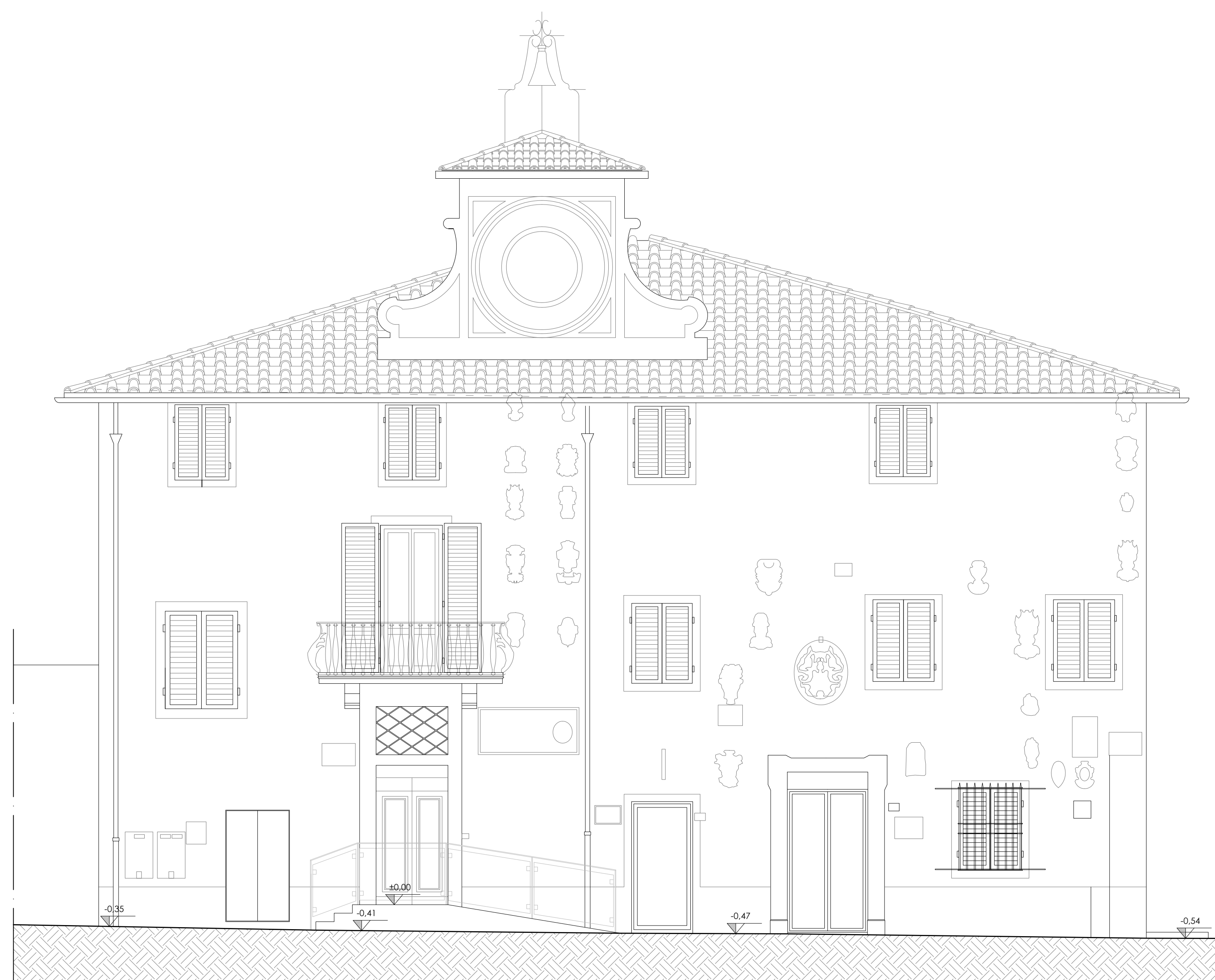
STATO DI PROGETTO - PROSPETTO NORD-OVEST SCALA 1:50