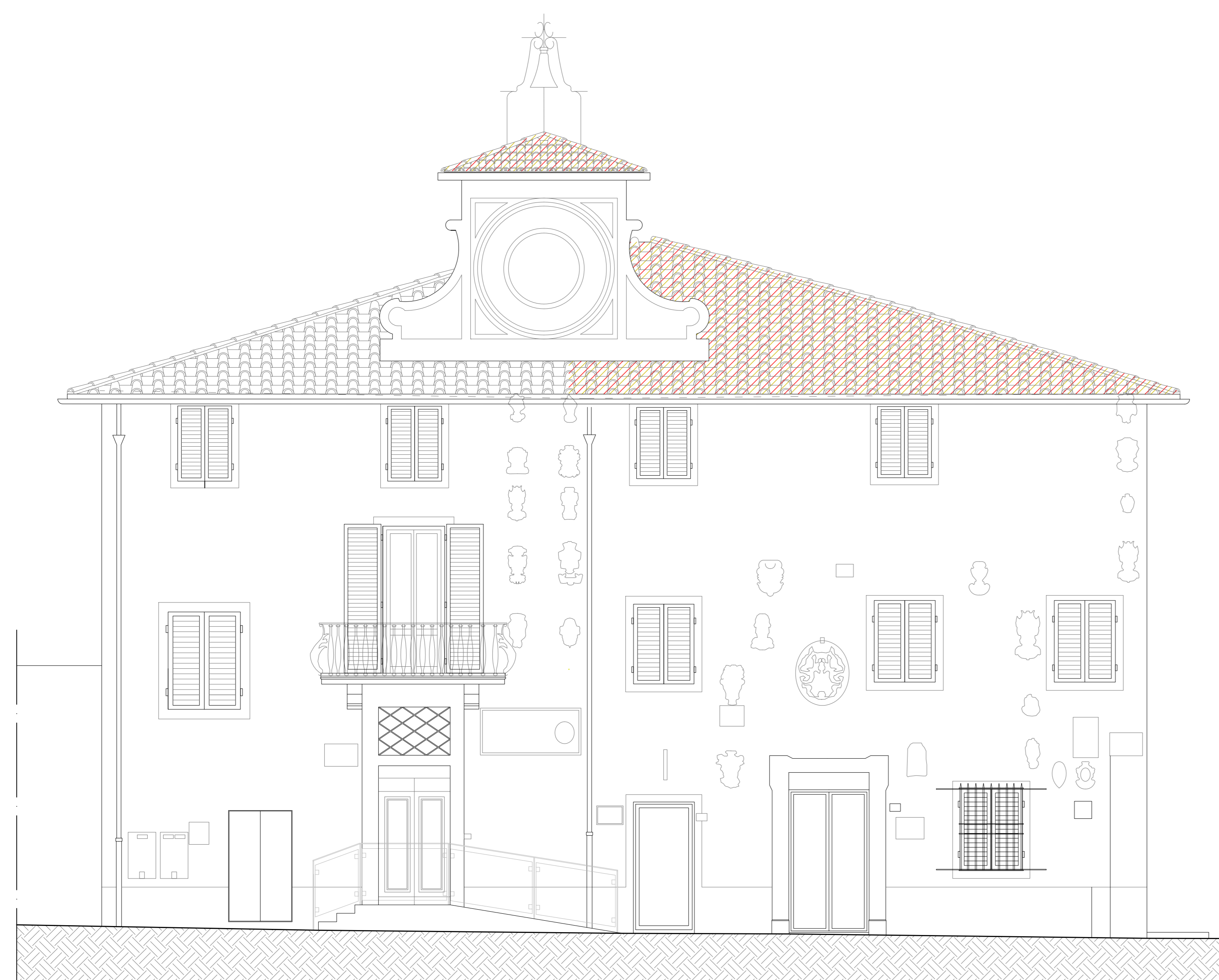
STATO SOVRAPPOSTO - PROSPETTO NORD-OVEST SCALA 1:50