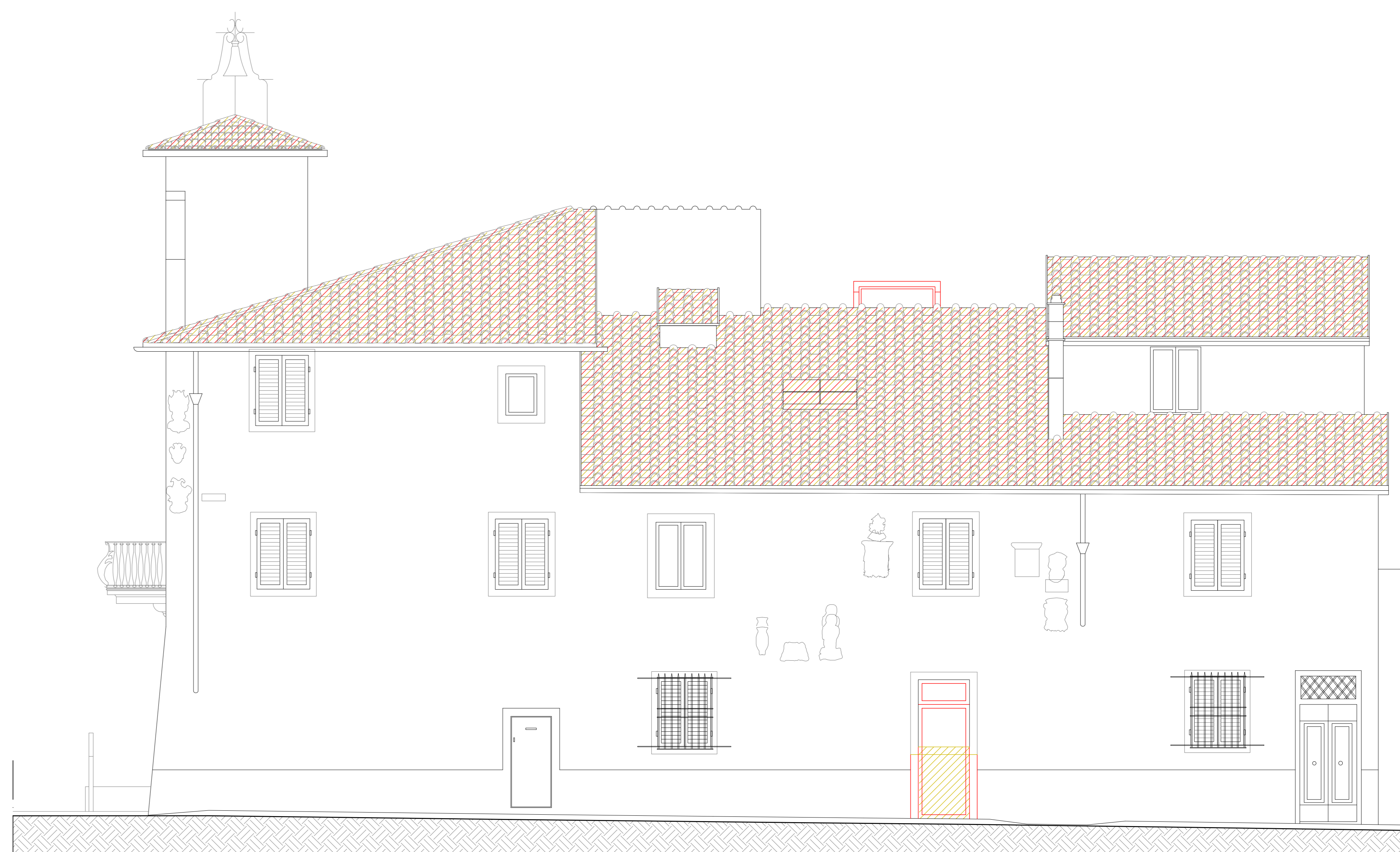
STATO SOVRAPPOSTO - PROSPETTO SUD-OVEST SCALA 1:50