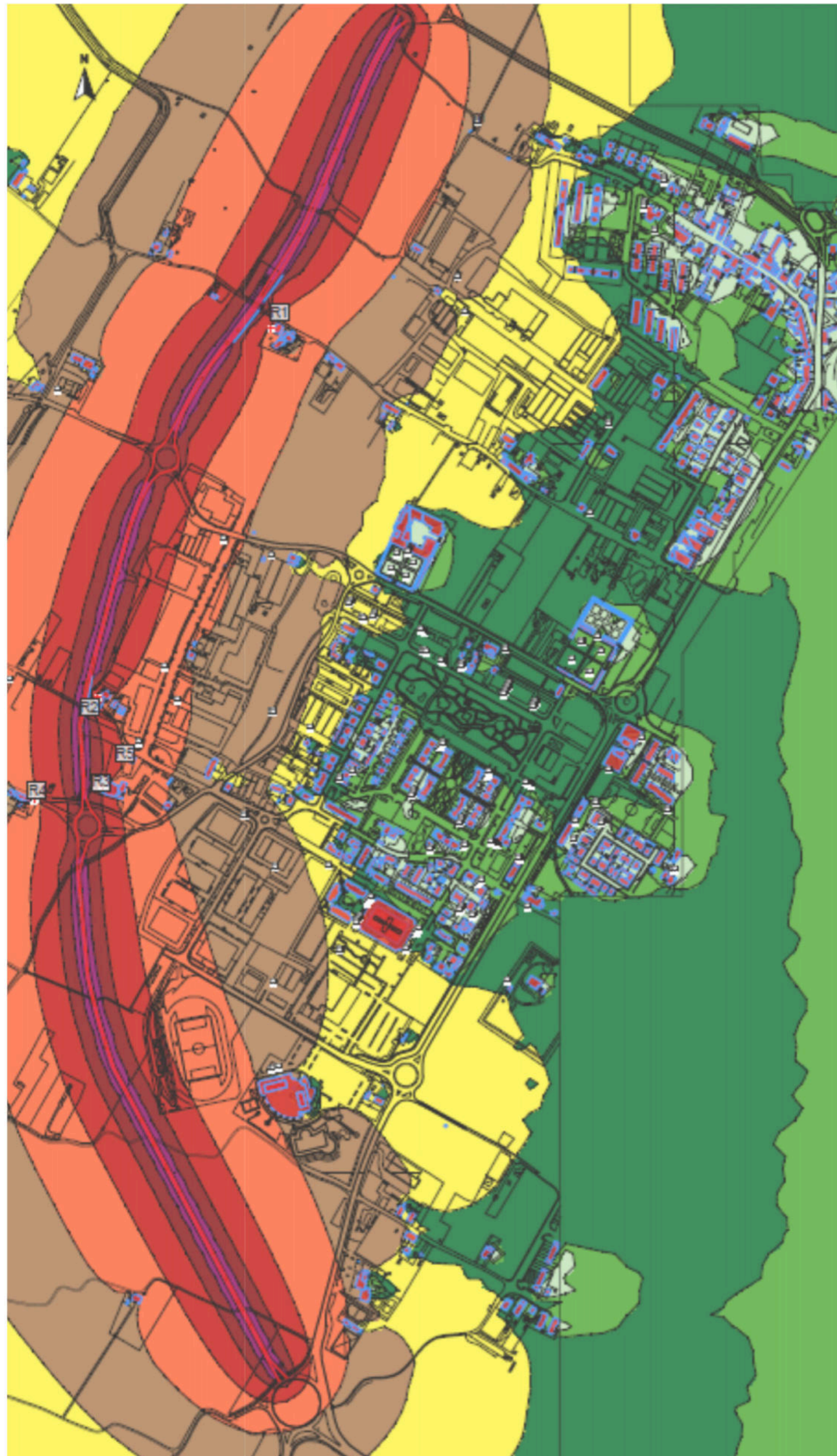
RUMORE DIURNO STATO DI PROGETTO

Modello Acustico Stato di Progetto Mitigato con Barriere Acustiche