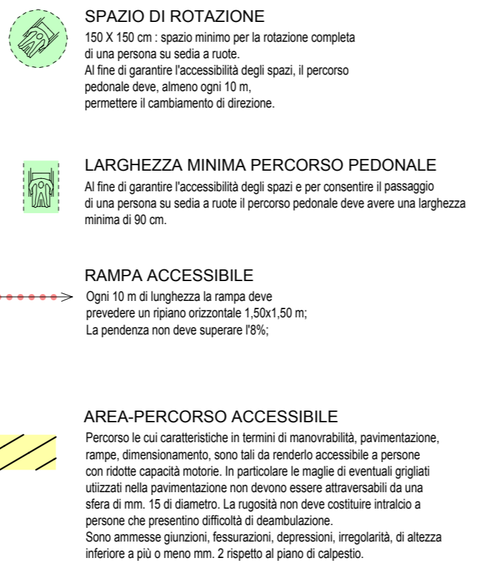
Planimetria Generale Legge 13/89 (e succ. mod. ed integ.)