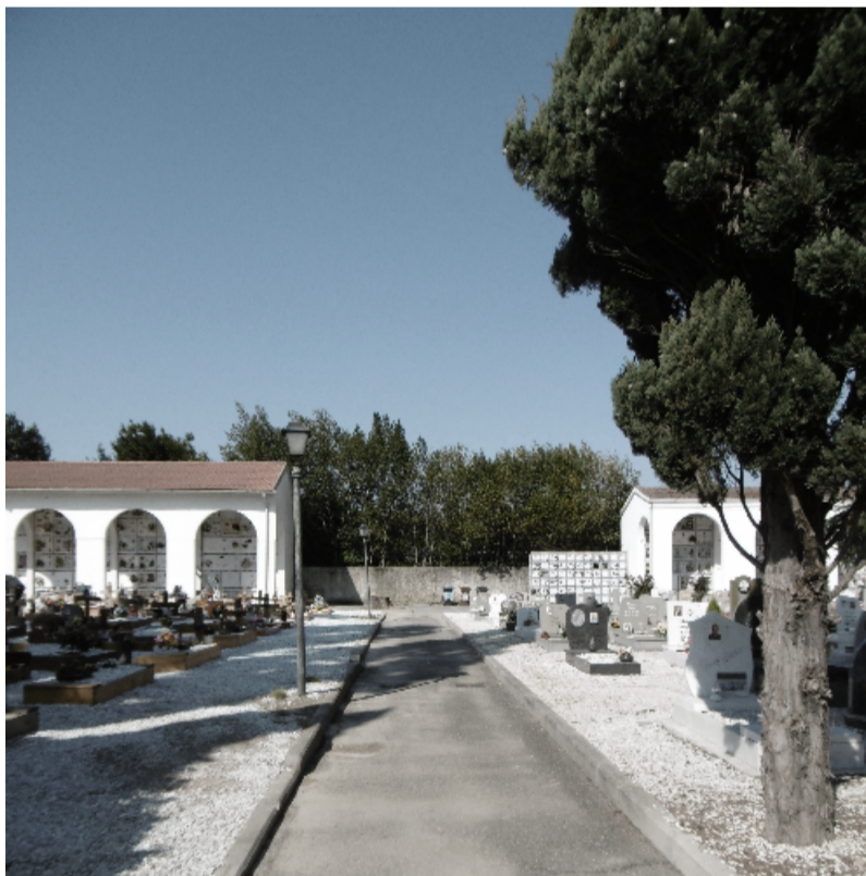
Punto di vista 2 FOTO Settembre 2022