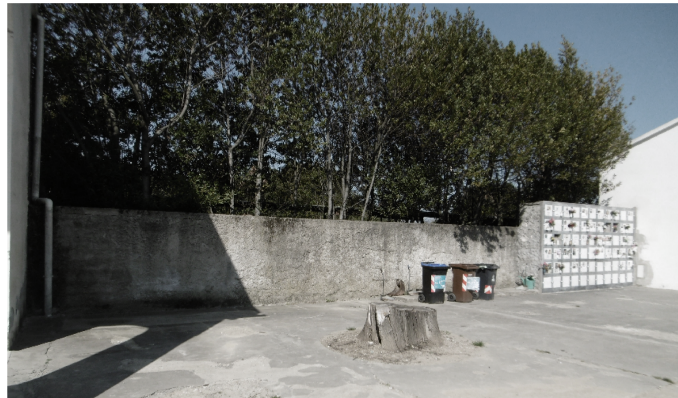
Punto di vista 3 FOTO Settembre 2022