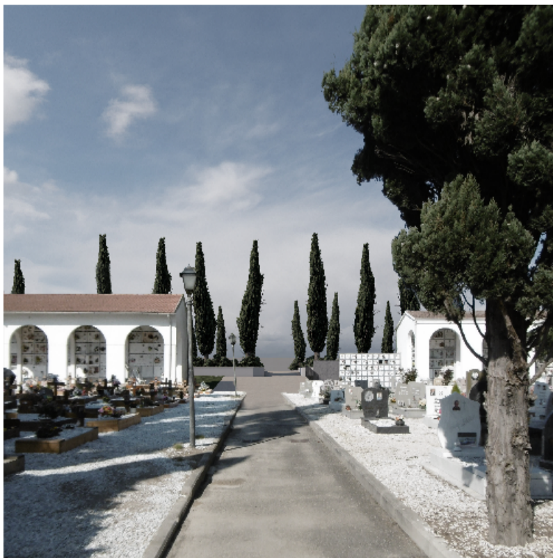
Punto di vista 2 FOTOINSERIMENTO