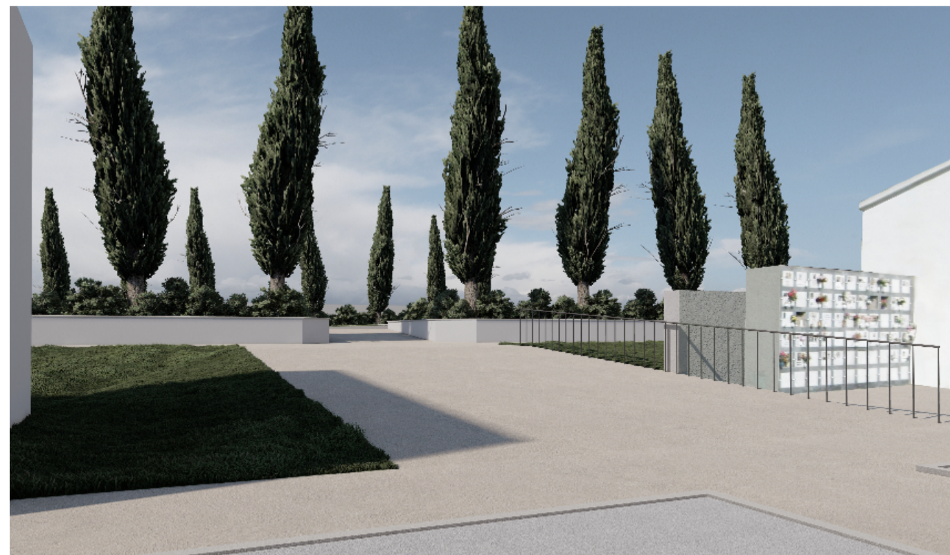
Punto di vista 3 FOTOINSERIMENTO