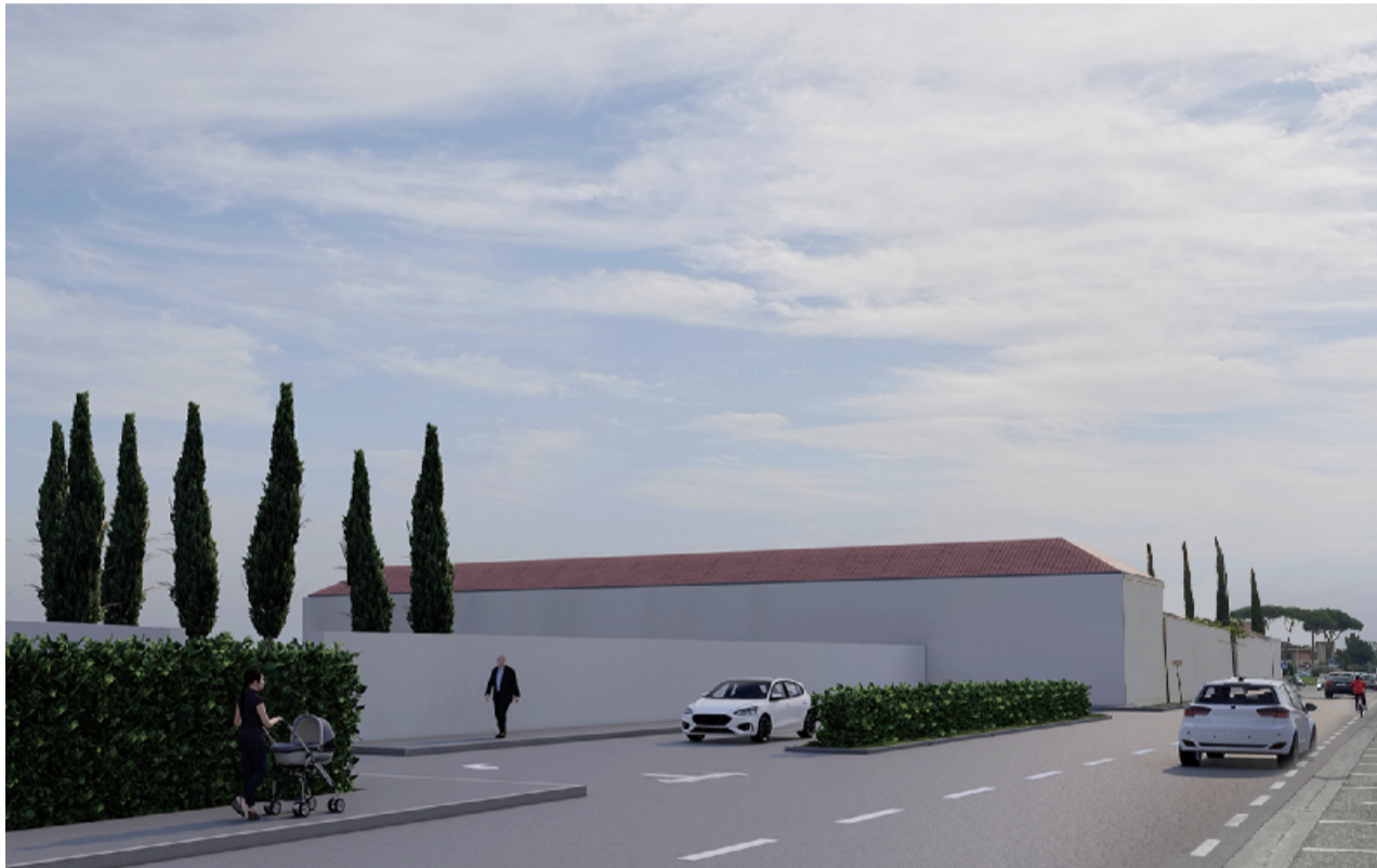
Punto di vista 1 FOTOINSERIMENTO