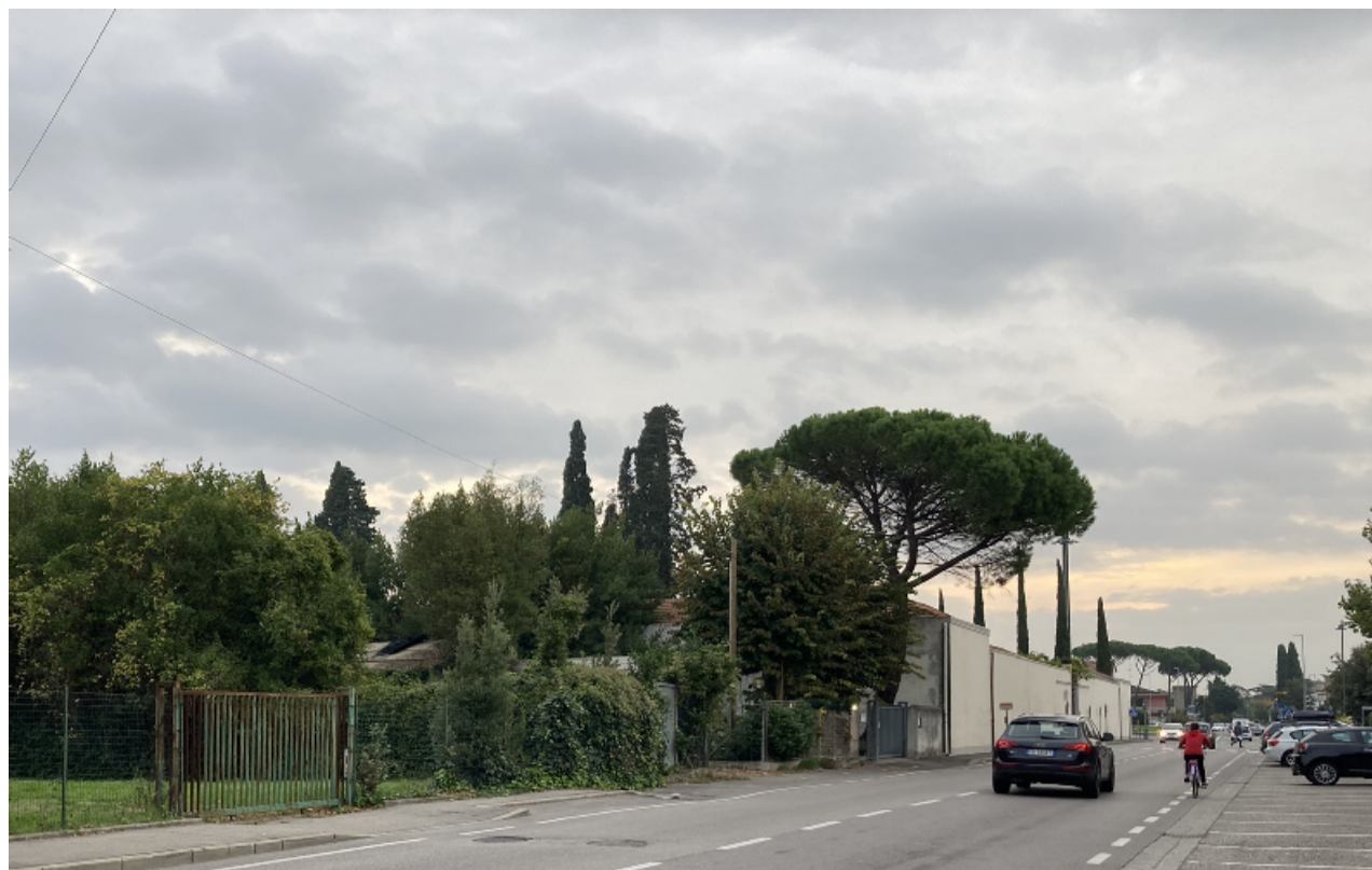
Punto di vista 1 FOTO Settembre 2022