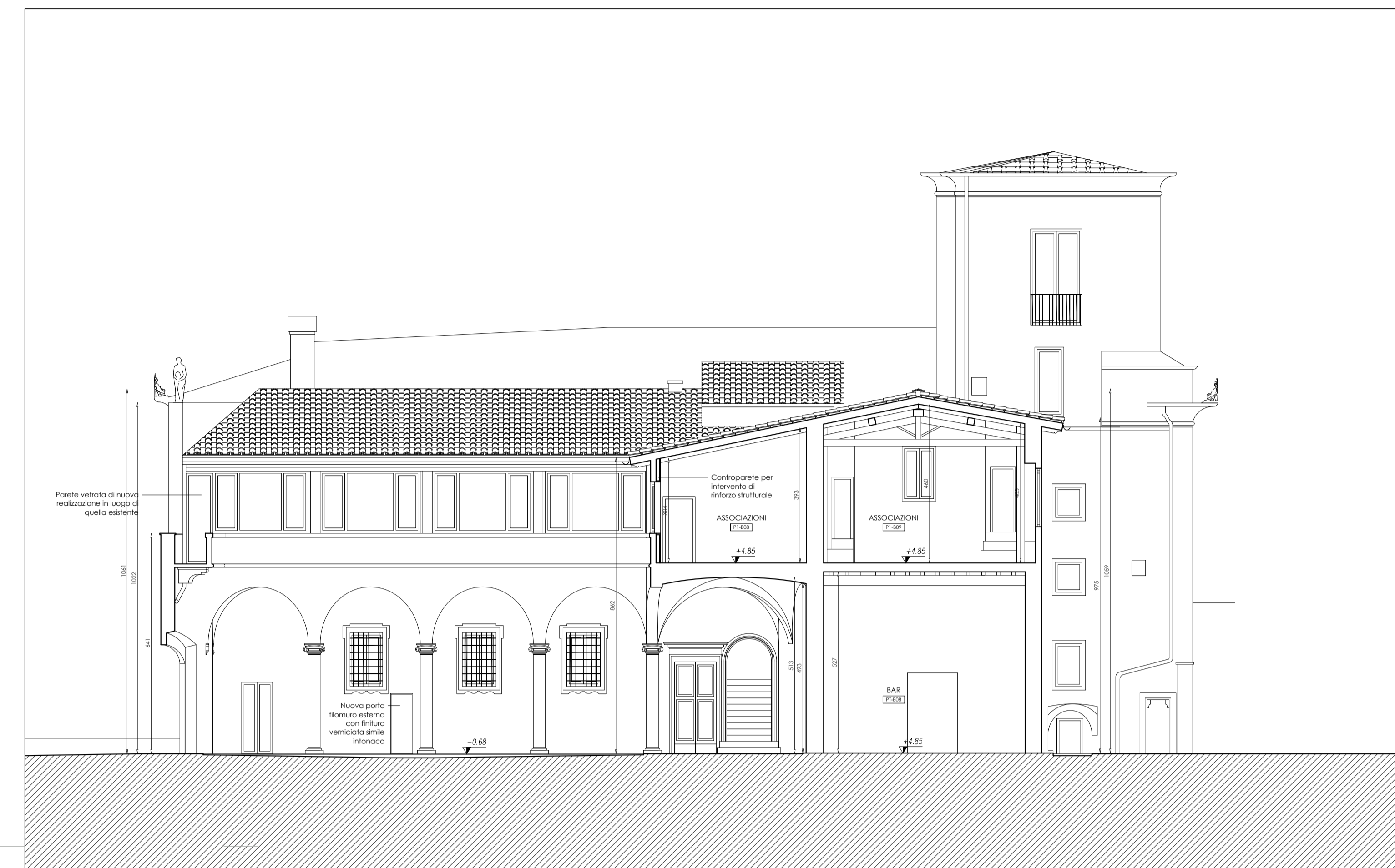
SEZIONE D | scala 1:100