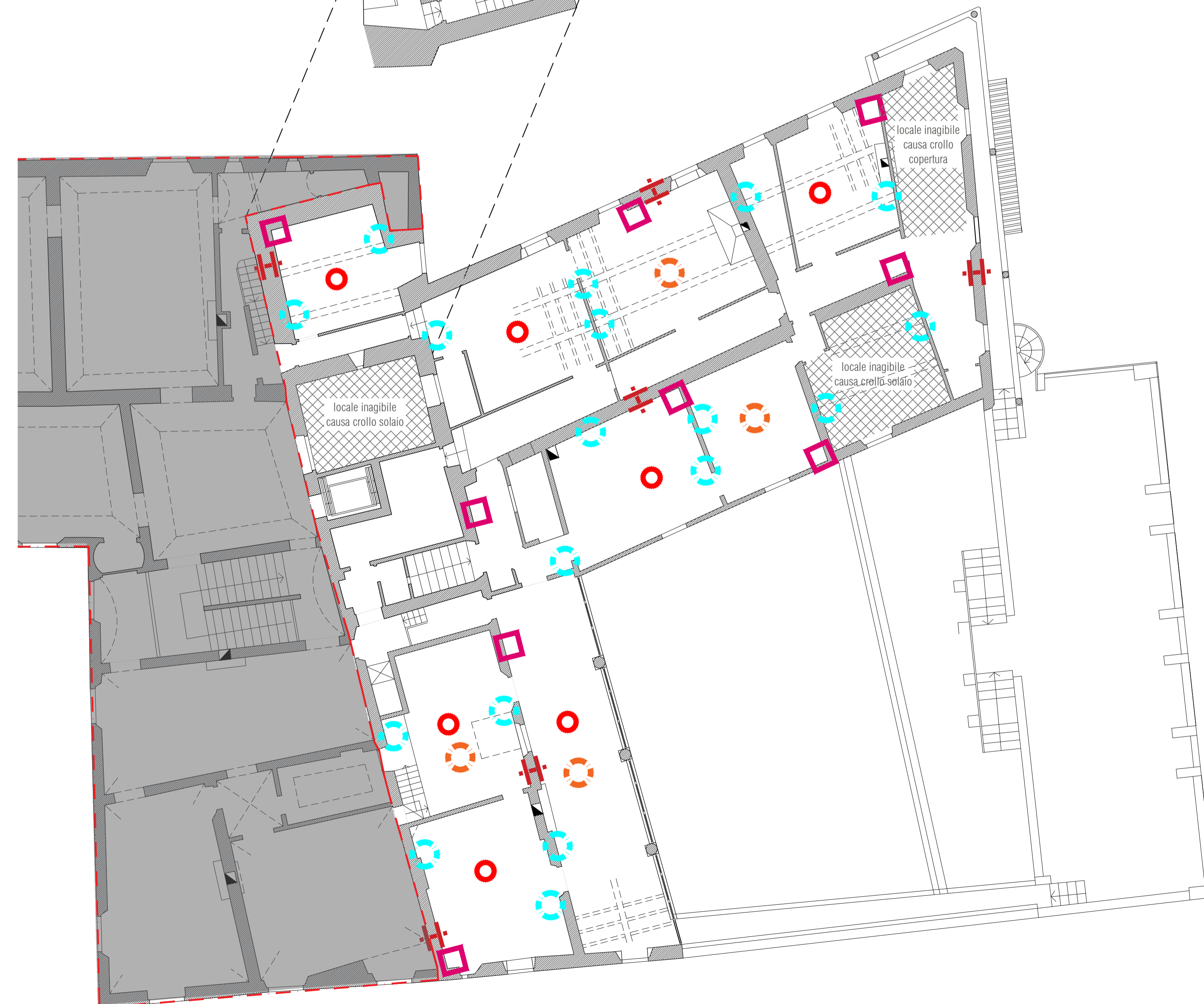
PIANTA PIANO PRIMO | scala 1:100