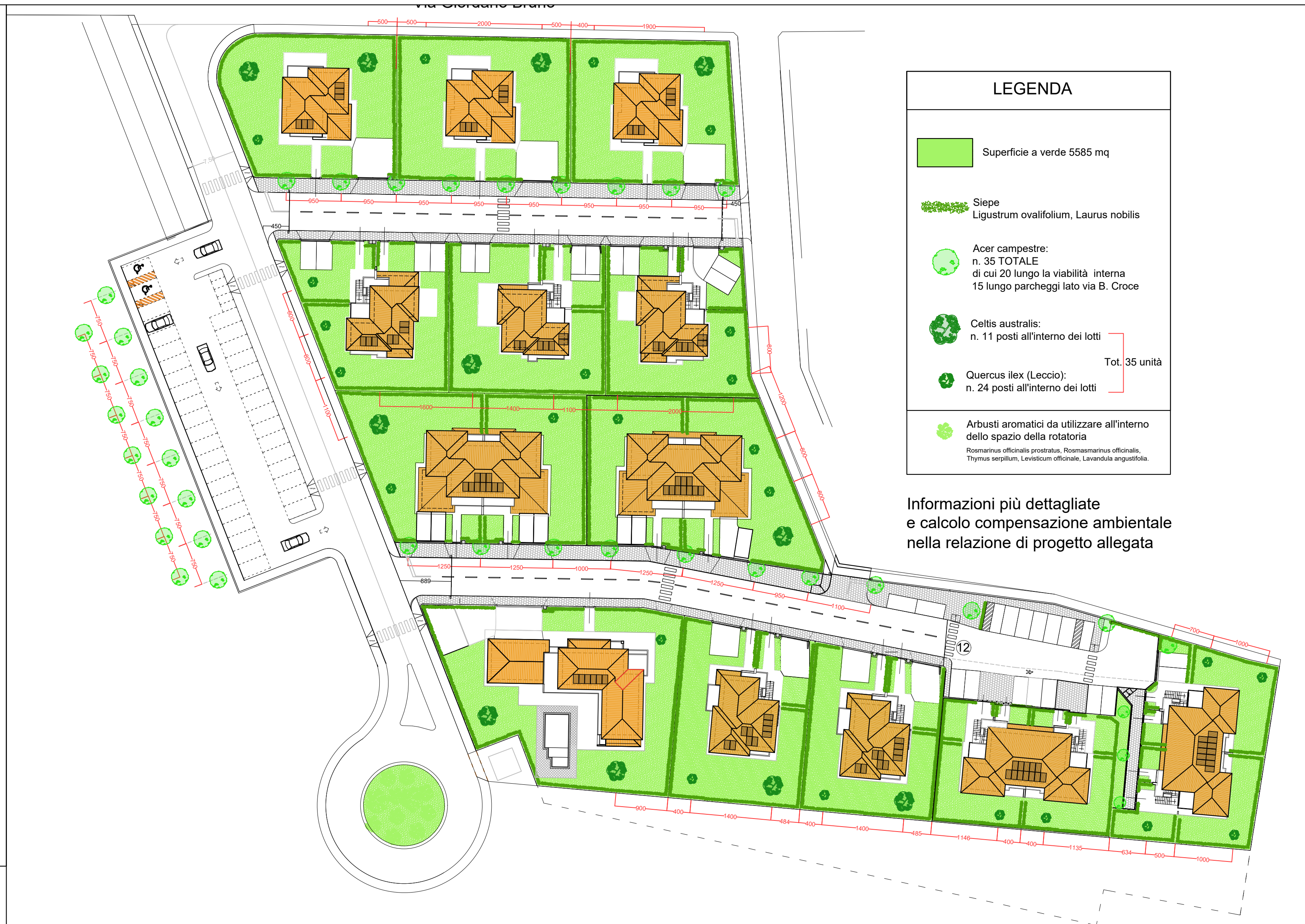
Planimetria di progetto Scala 1:500