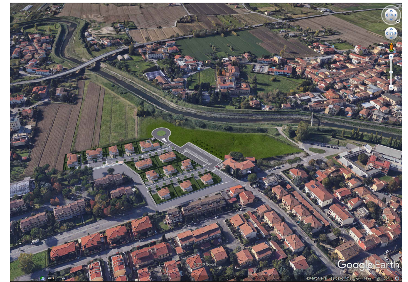
H - Fotoinserimento verso argine del fiume Bisenzio