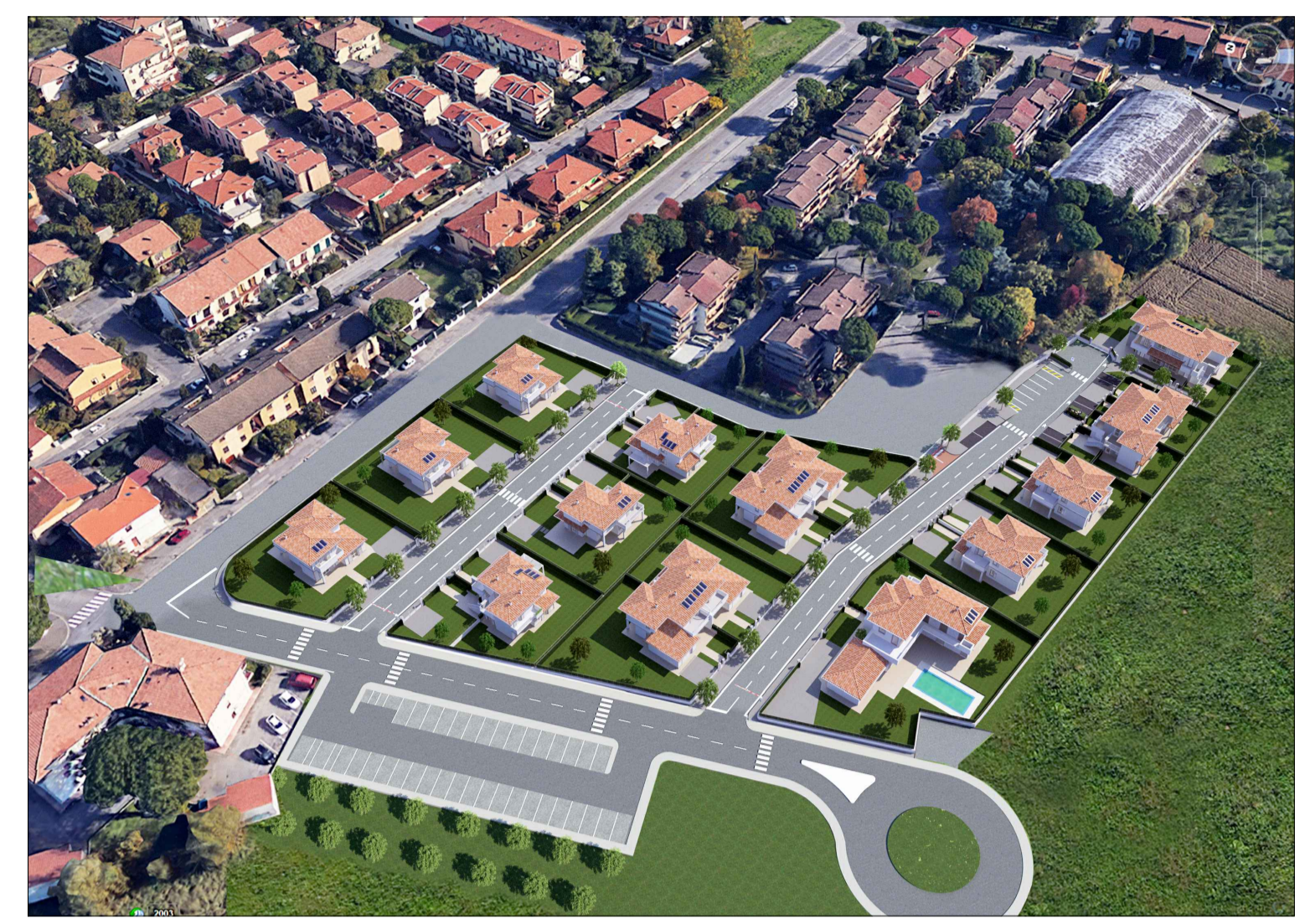
B - Fotoinserimento