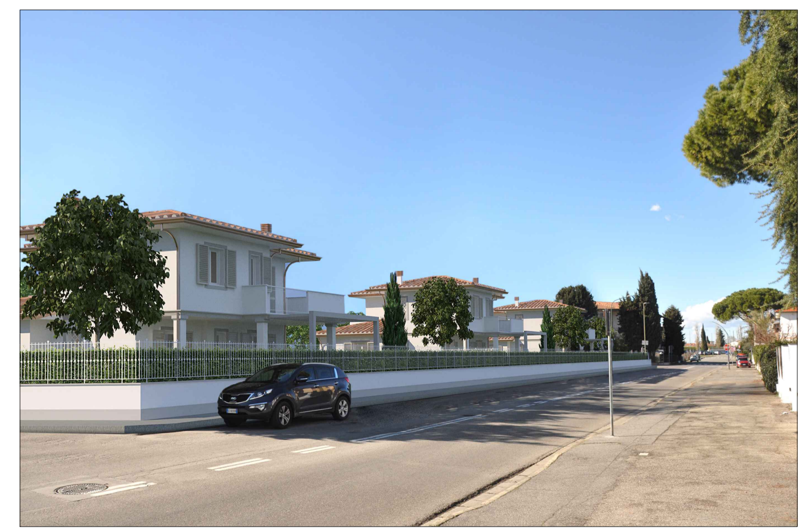
D - Fotoinserimento Via Giordano Bruno verso argine del fiume Bisenzio