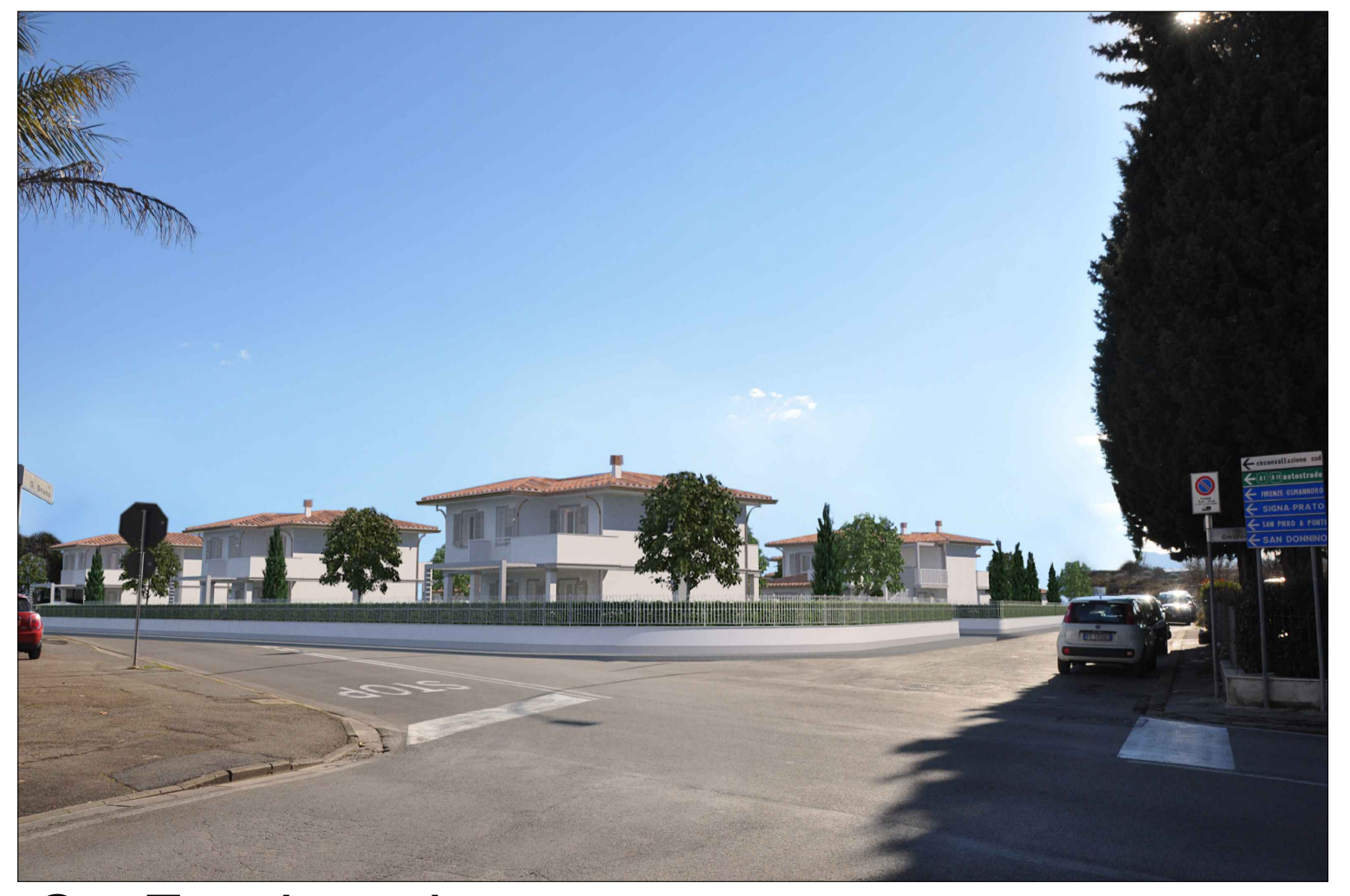
C - Fotoinserimento incrocio Via Benedetto Croce - Via Giordano Bruno