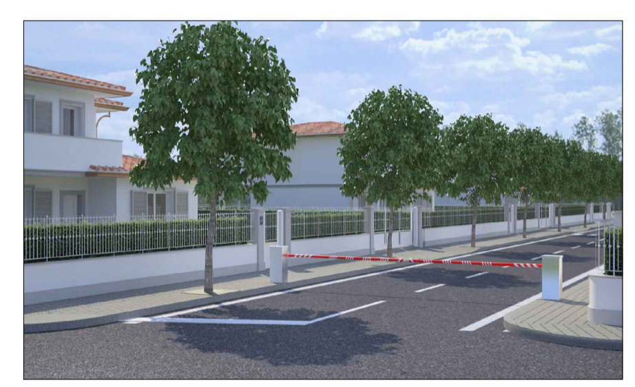
Rendering - da Via Benedetto croce verso nuova viabilità