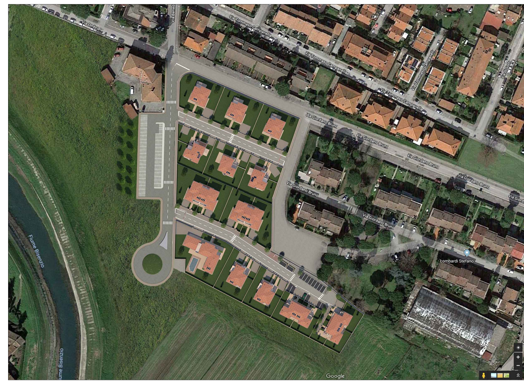
FOTOINSERIMENTO vista zenitale