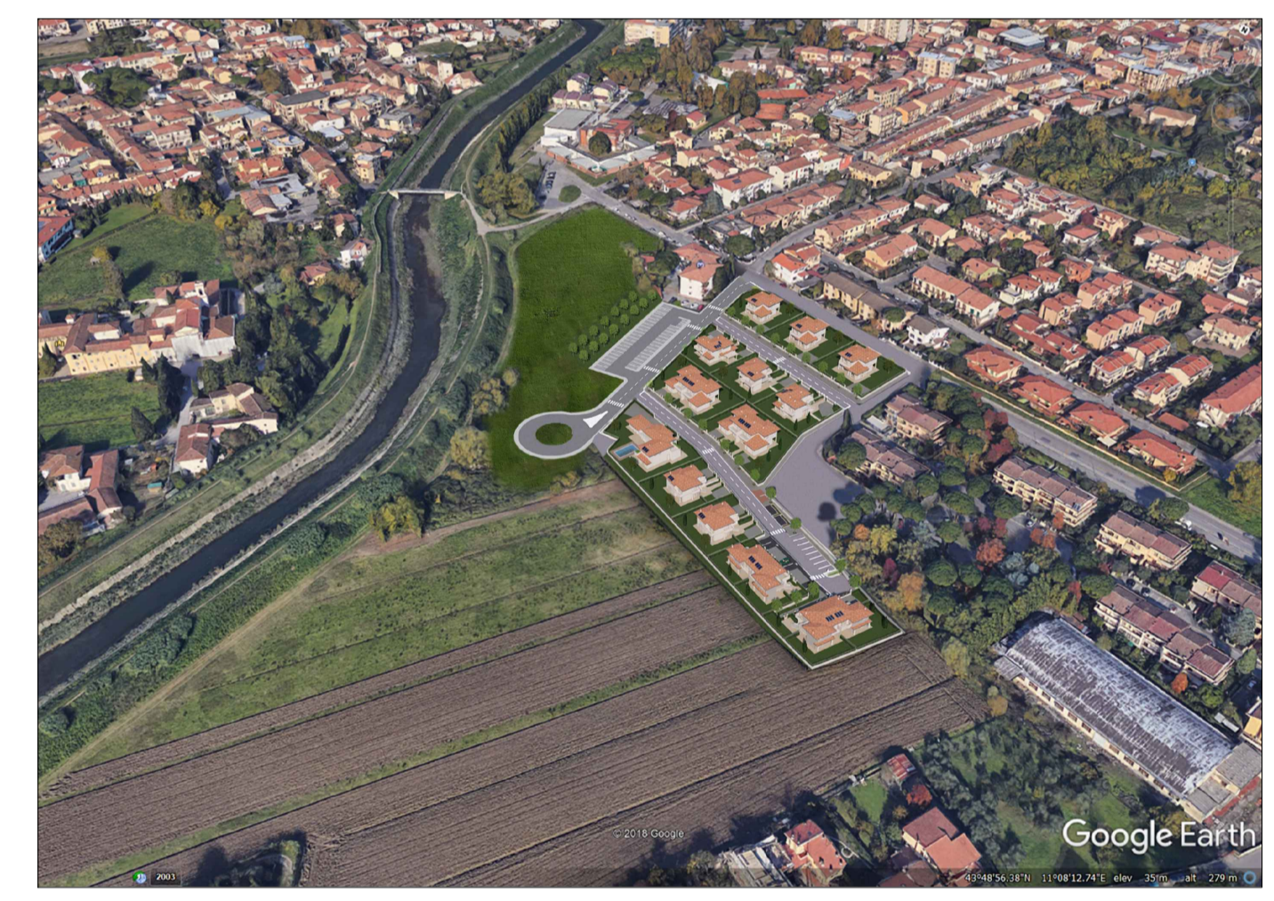
G - Fotoinserimento verso argine del fiume Bisenzio