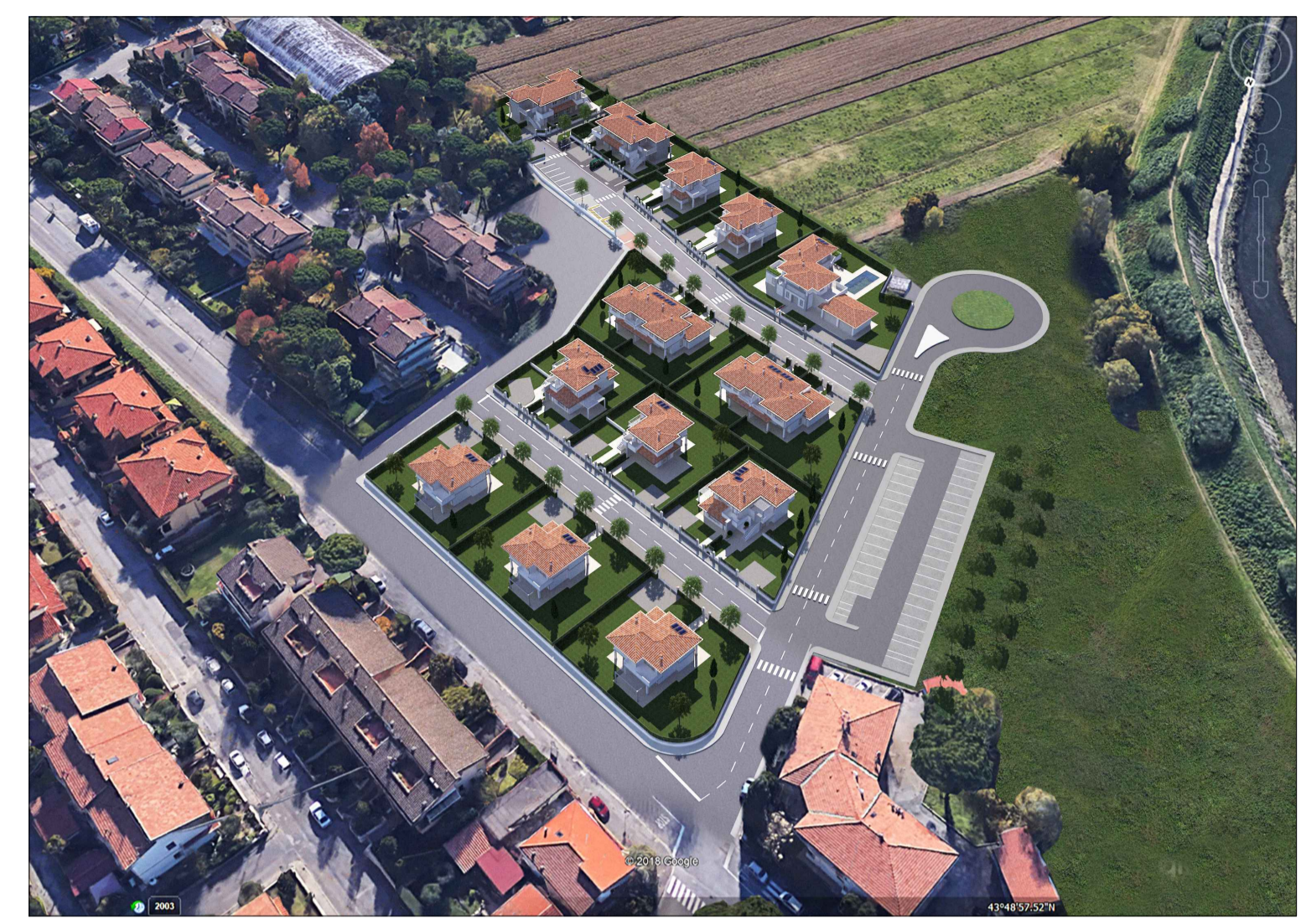
A - Fotoinserimento