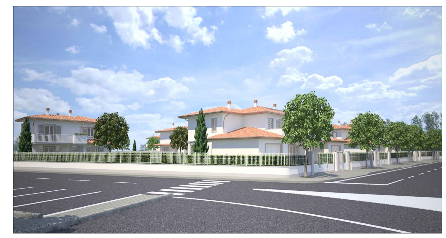
E - Rendering