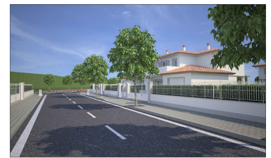
Rendering - Vista verso l'argine dalla nuova viabilità privata