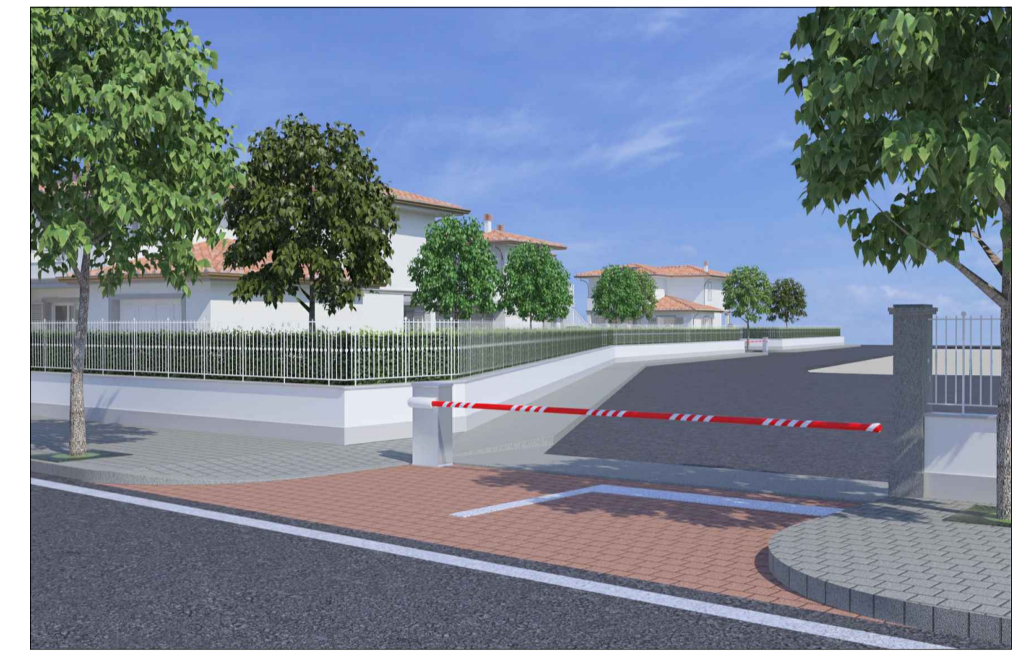
F - Rendering