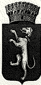
Comune di Campi Bisenzio