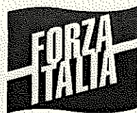
Gruppo Forza Italia