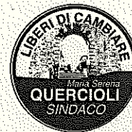
Gruppo Liberi di Cambiare