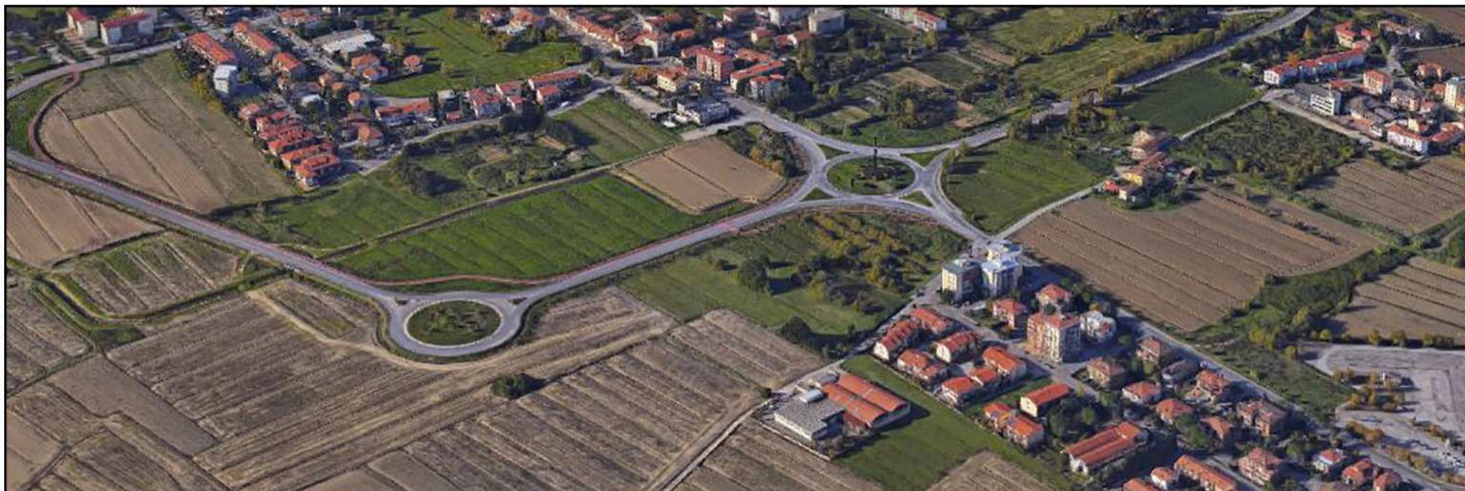
VEDUTA DA NORD-EST