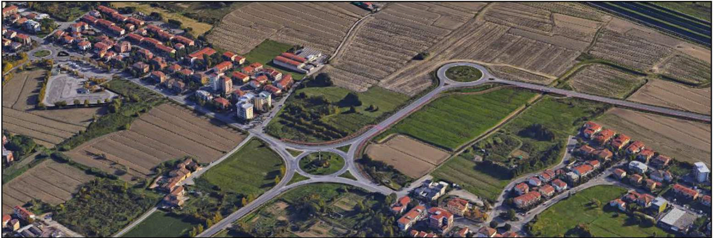
VEDUTA DA SUD-OVEST