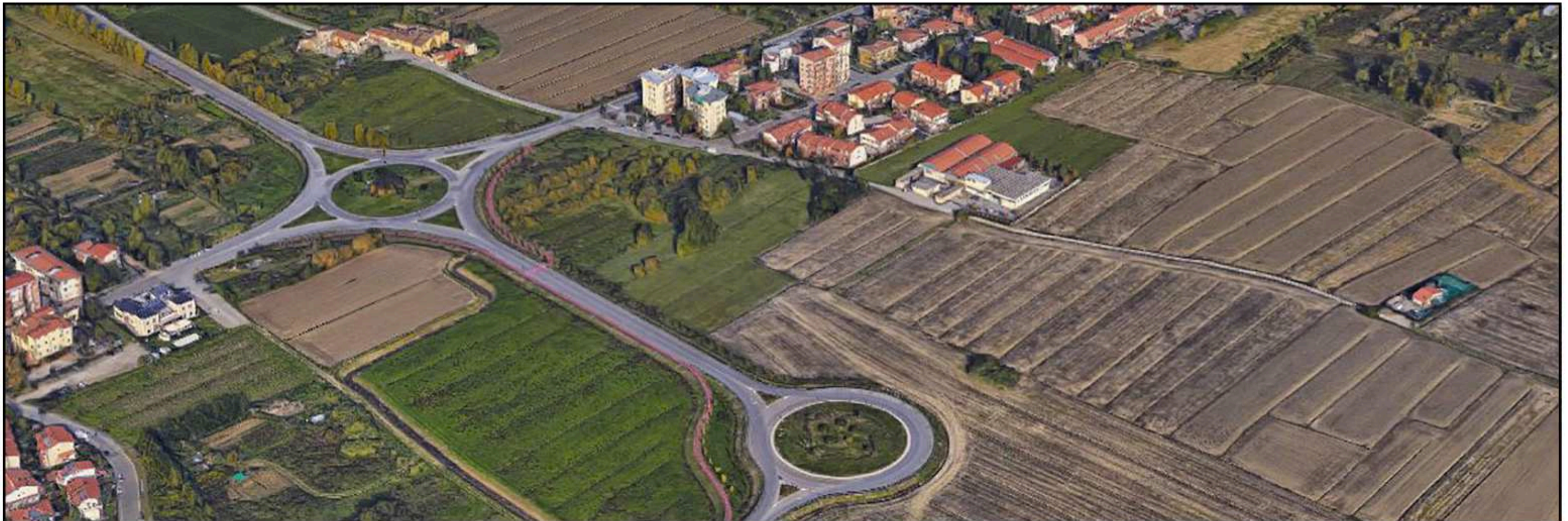
VEDUTA DA SUD-EST