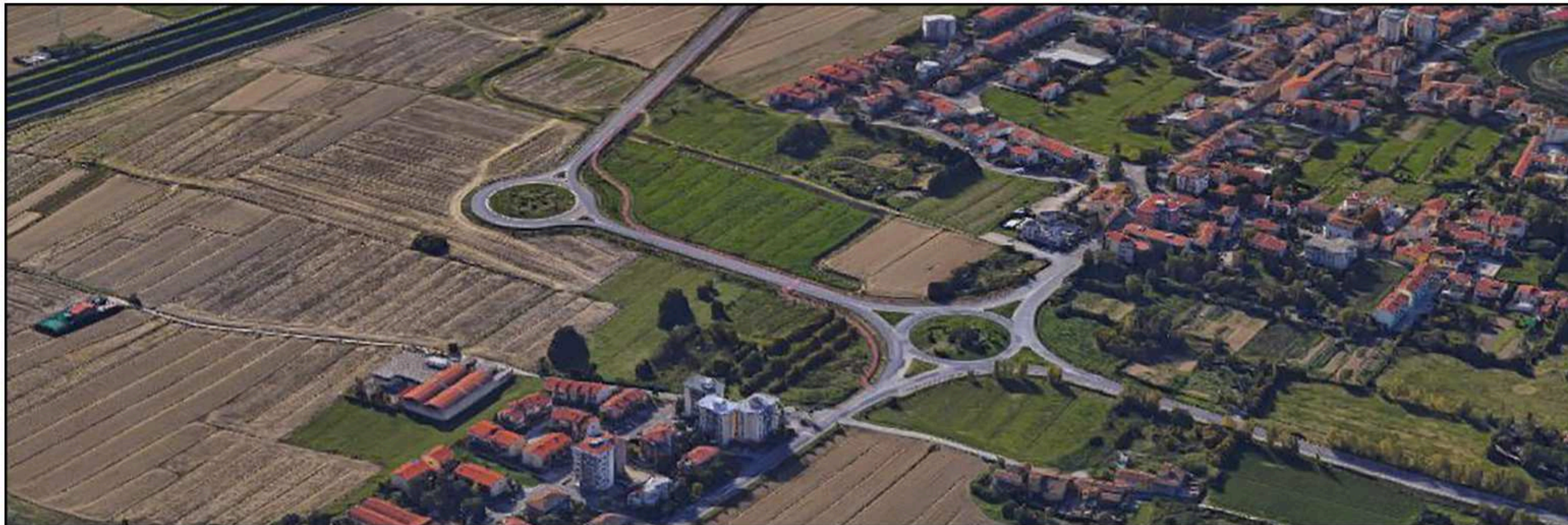
VEDUTA DA NORD-OVEST