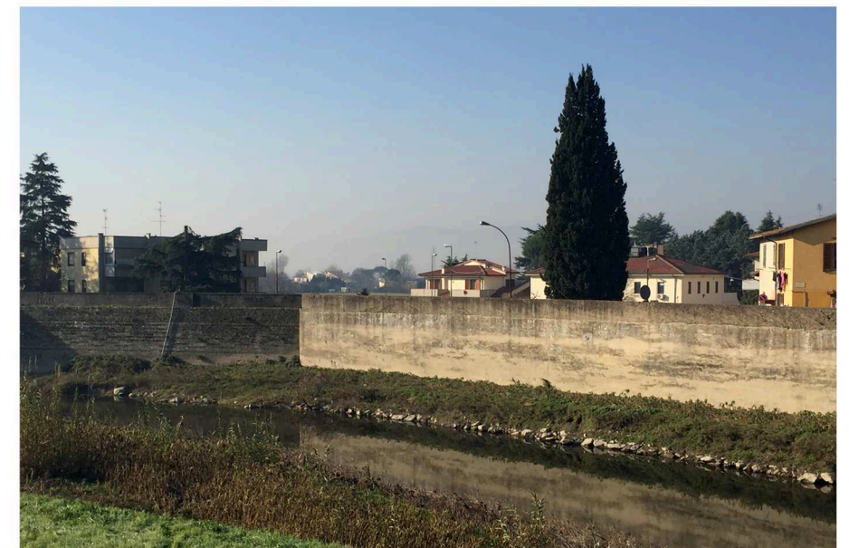
foto n. 36 area oggetto di intervento vista dall'argine del fiume Bisenzio