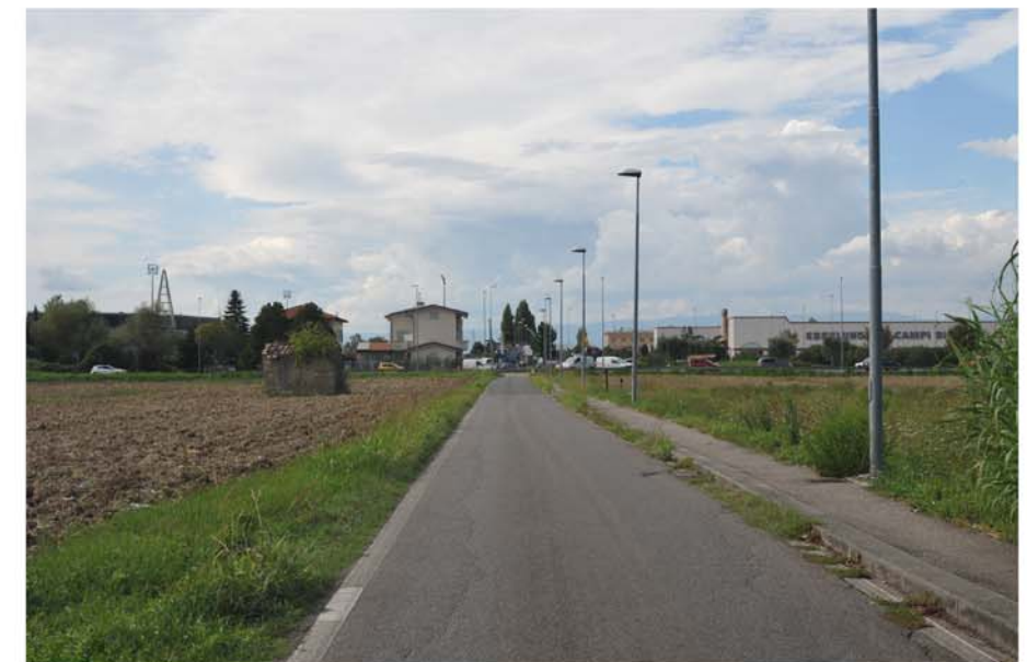
foto n.18 Via di Gramignano in prossimità di Via Barberinese