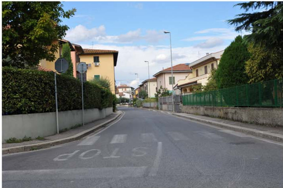
foto n. 19 Via San Lorenzo