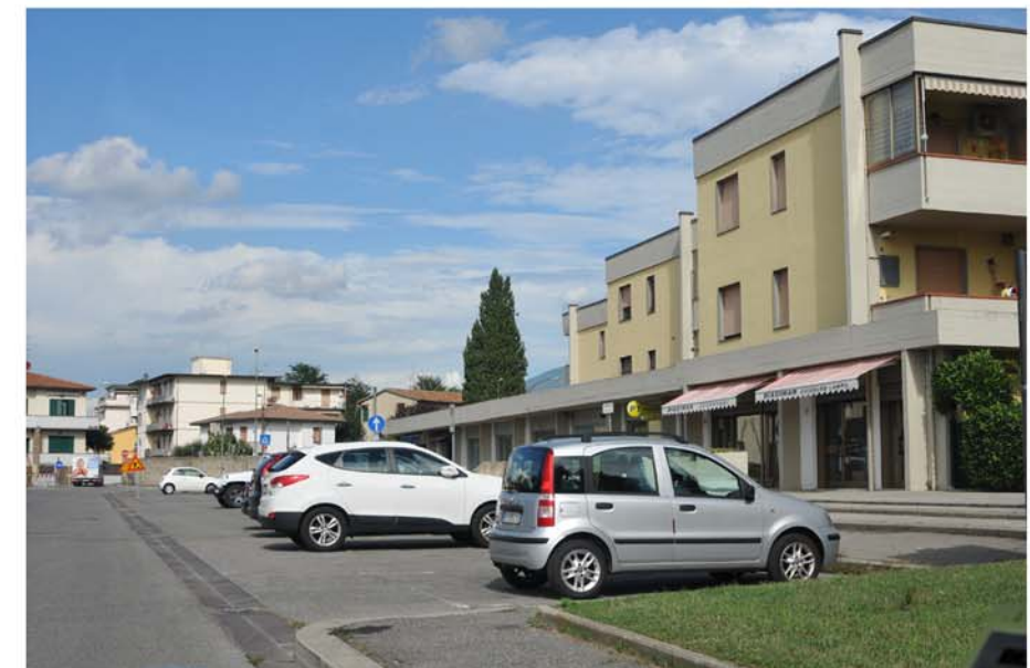
foto n.6 attività commerciali in Via Pimentel