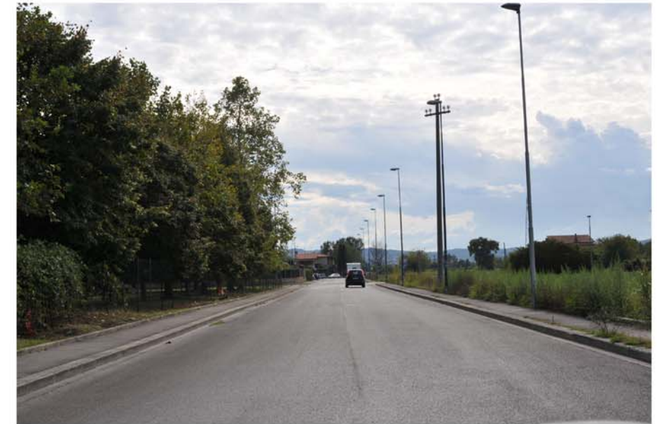
foto n. 12 Via Suor Teresa Manetti, sulla sinistra i giardini pubblici