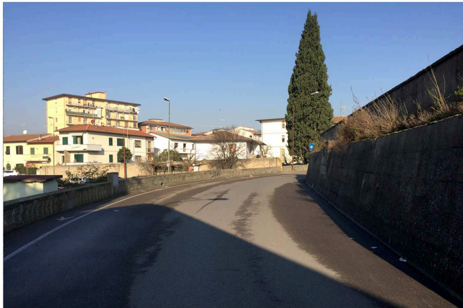
foto n. 28 Via San Martino