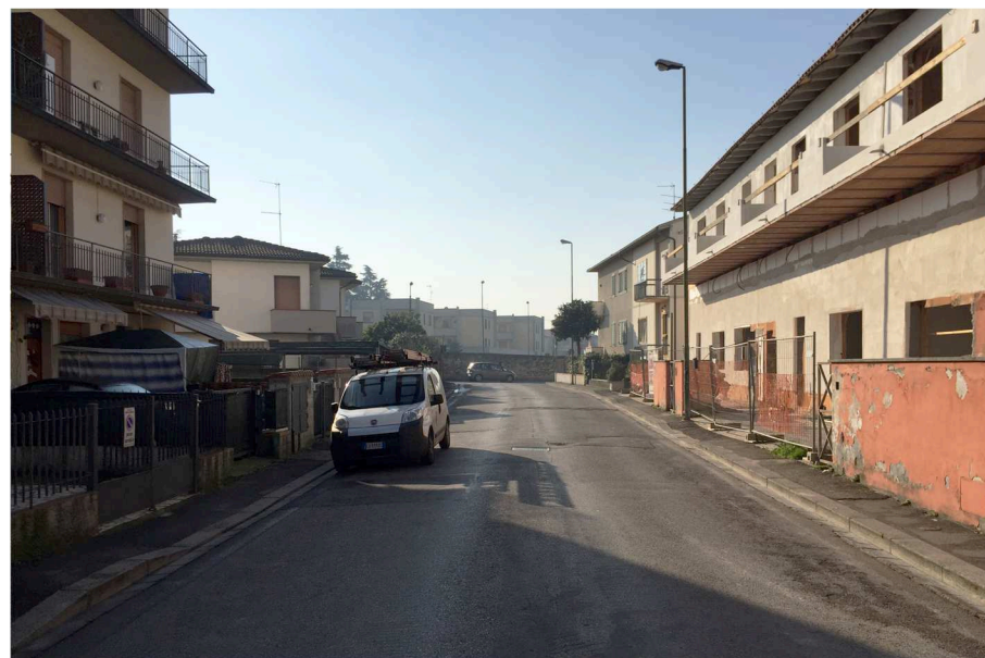
foto n. 35 Via Montanara