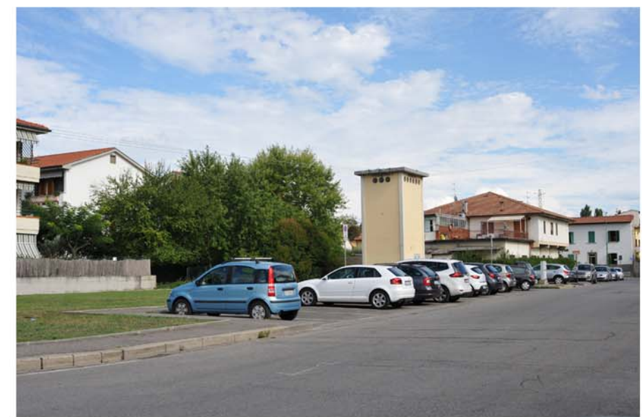
foto n.9 parcheggio pubblico Via Suor Teresa Manetti