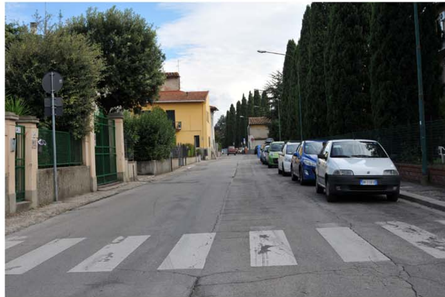
foto n. 20 Via del Paradiso