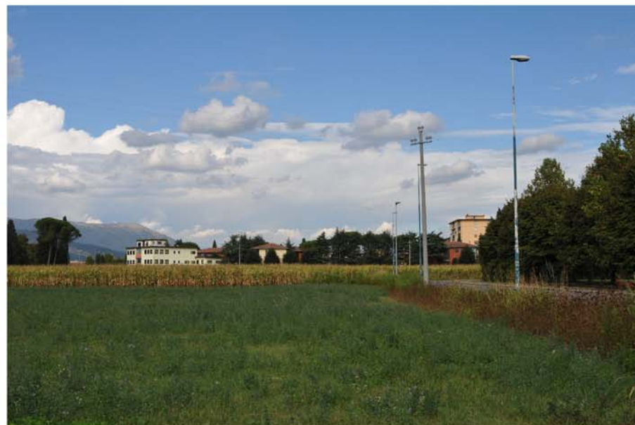
foto n.17 l'area di intervento vista da Via di Gramignano