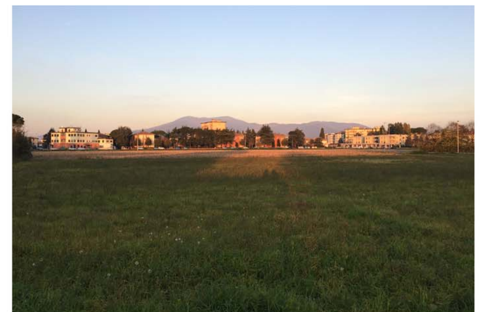
foto n. 27 area oggetto di intervento vista da Via Gramignano