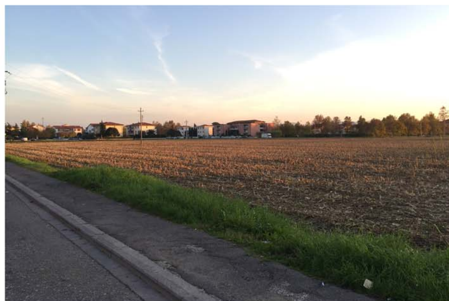
foto n. 26 area oggetto di intervento vista da Via Saffi