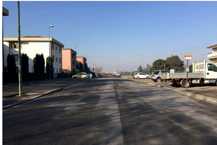
foto n. 29 Via Suor Teresa Manetti