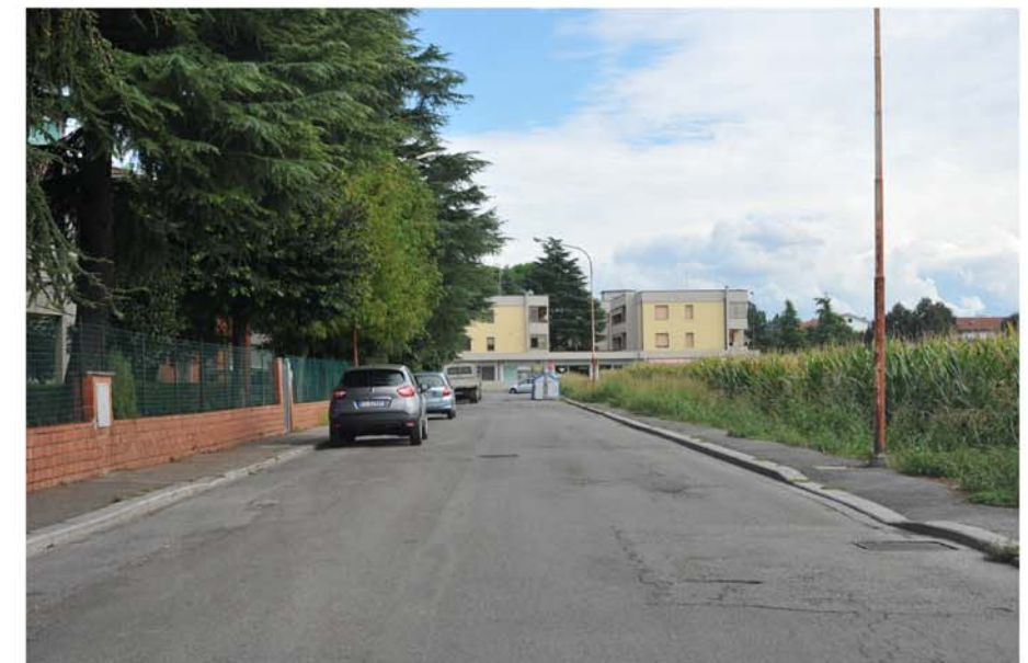
foto n. 24 Via Saffi