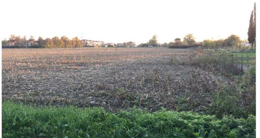
foto n.25 area oggetto di intervento vista da Via Saffi. Sulla dx gli orti sociali