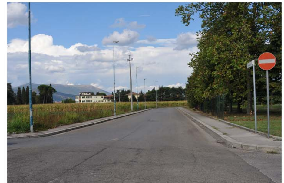
foto n.15 Via di Gramignano ang. Via Fratesi. Sullo sfondo la sede della Misericordia