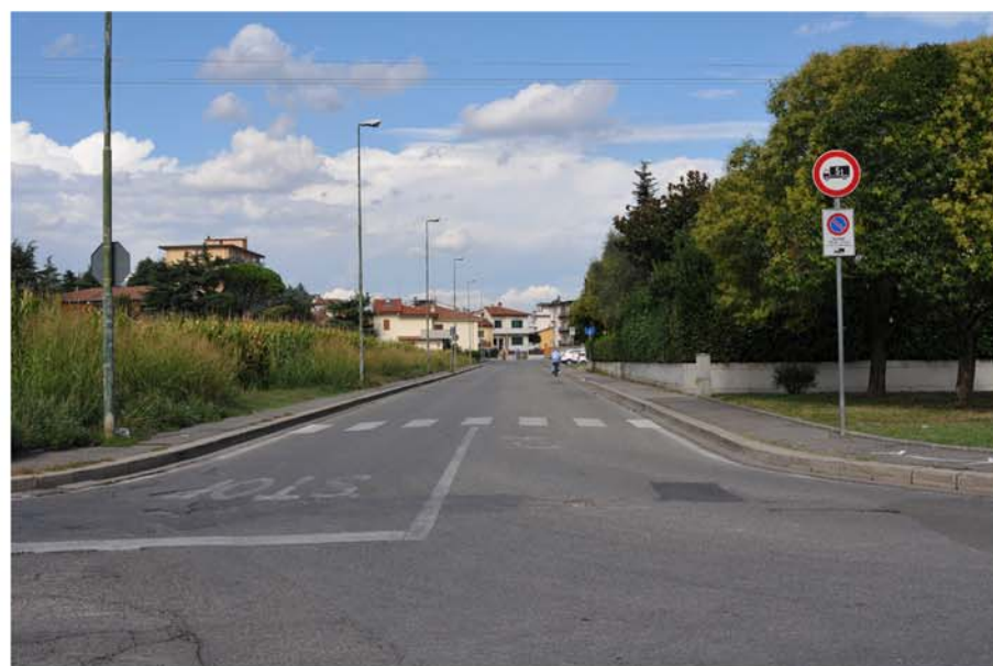
foto n.8 Via Pimentel angolo Via Suor Teresa Manetti