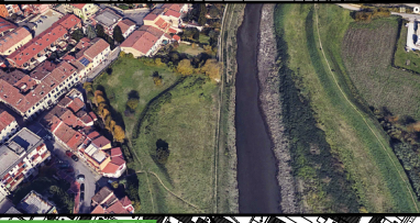
D5 - Area verde "Santa Maria"