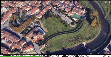
D7 - Area verde "Rocca Strozzi"