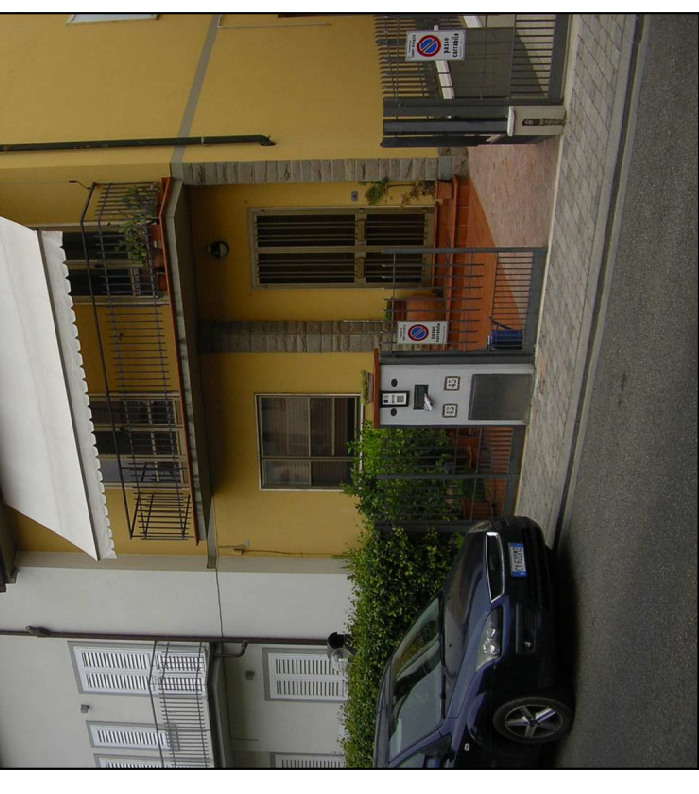
VIA GENOVA 41 - 43