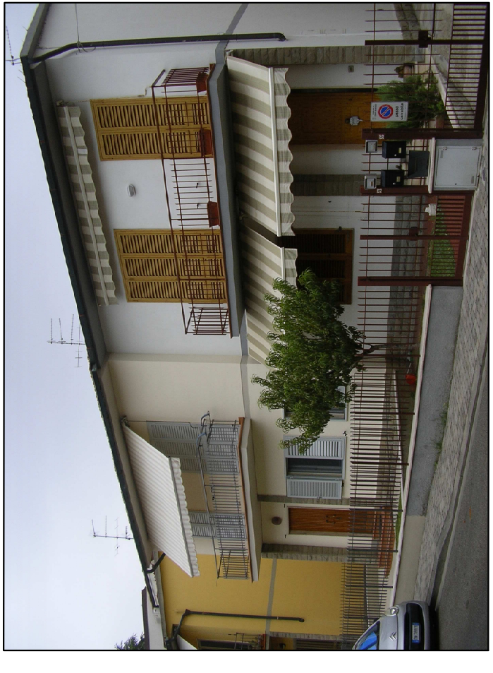
VIA GENOVA 49 - 51