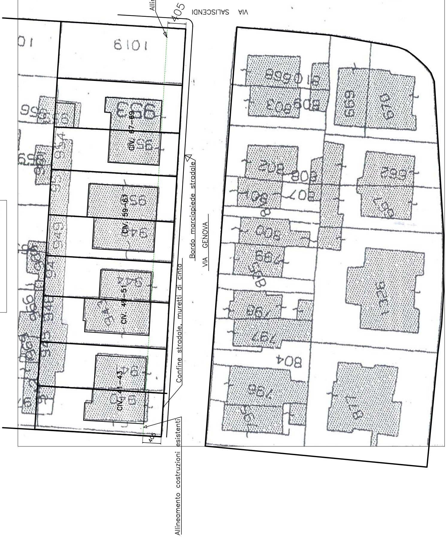
Allineamenti stradali e fabbricati Scala 1:250