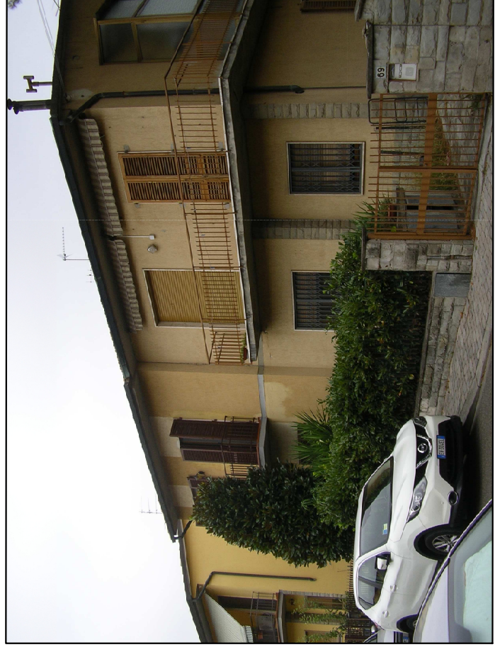
VIA GENOVA 67 - 69