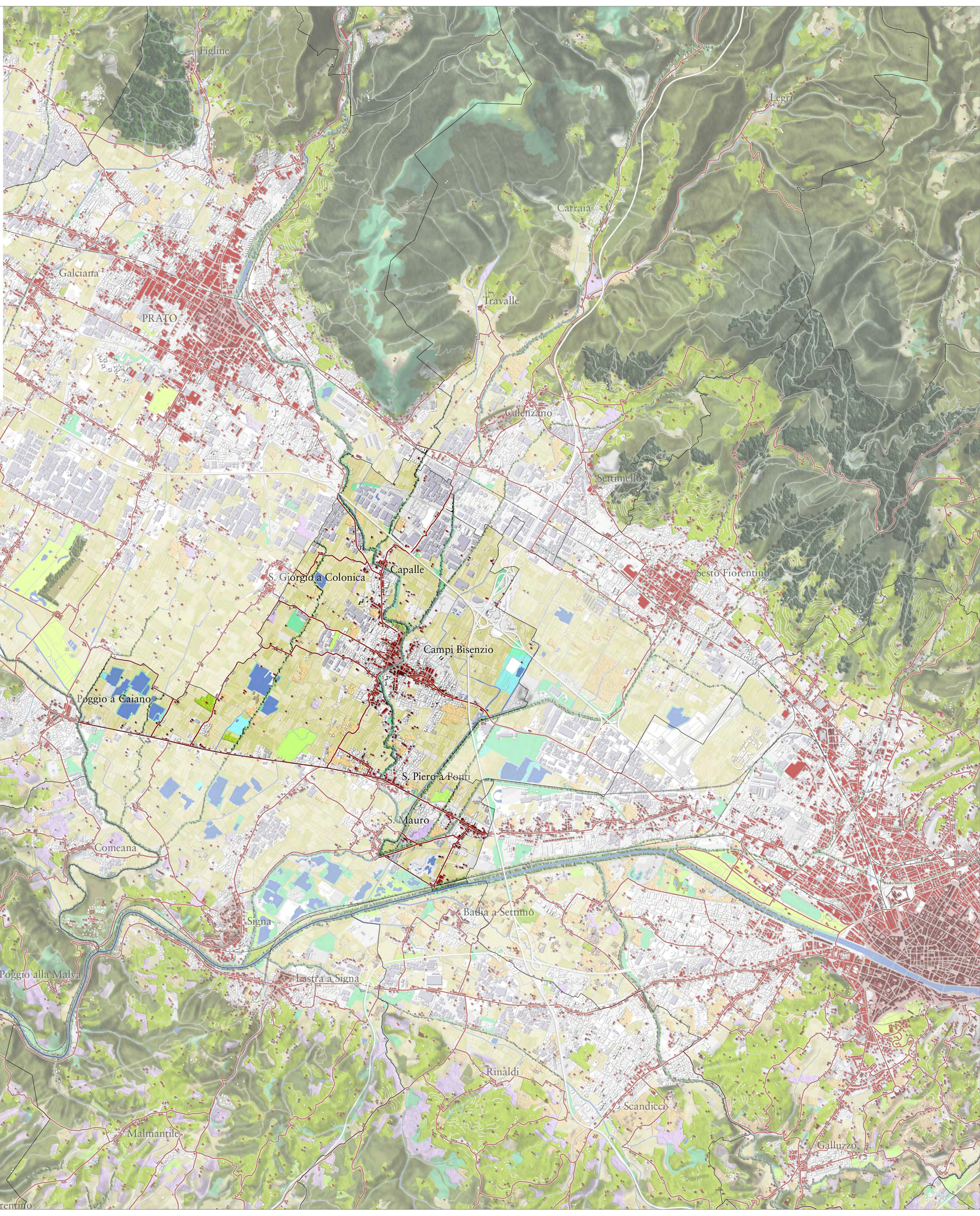
PIT-PPT - Profilo dell'ambito - Ambito di paesaggio 6 - Firenze Prato Pistoia