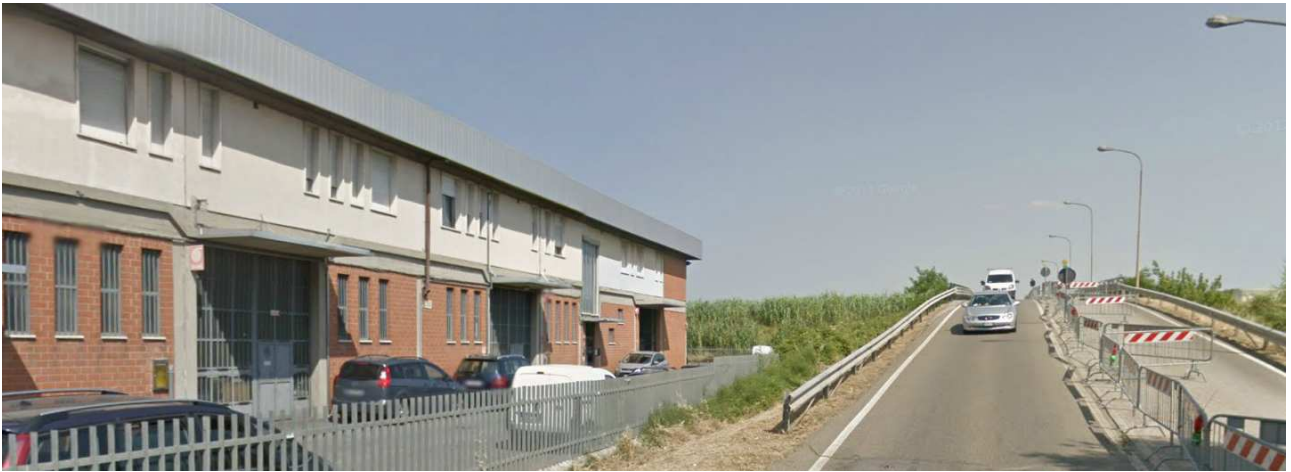
Foto della zona