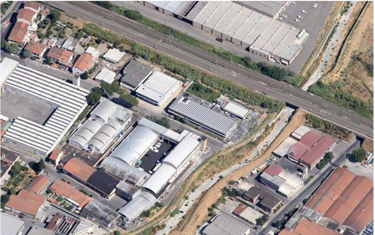
foto aerea di dettaglio