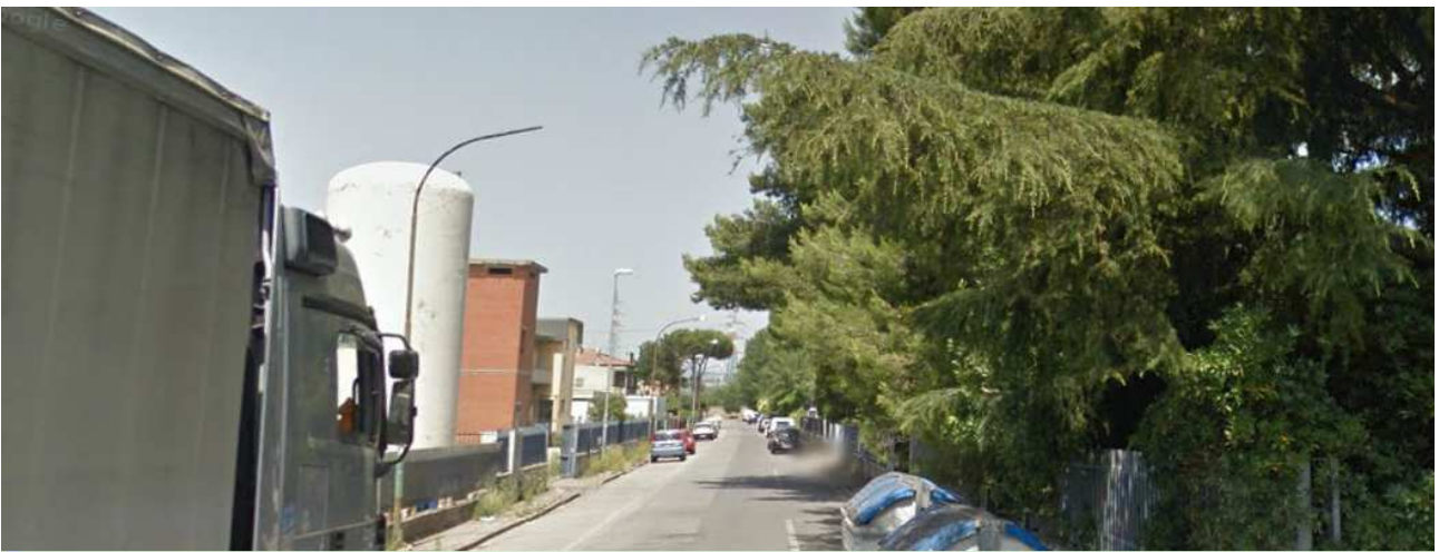
Foto della zona