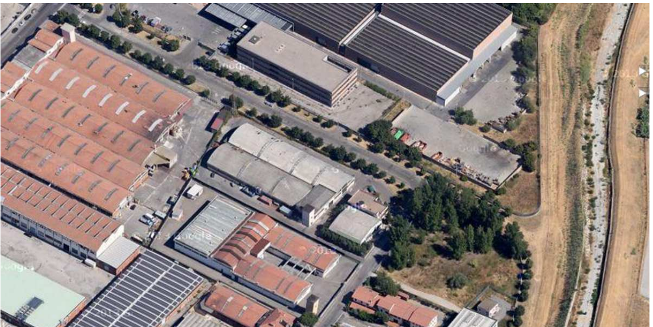
Google maps - foto aerea di dettaglio