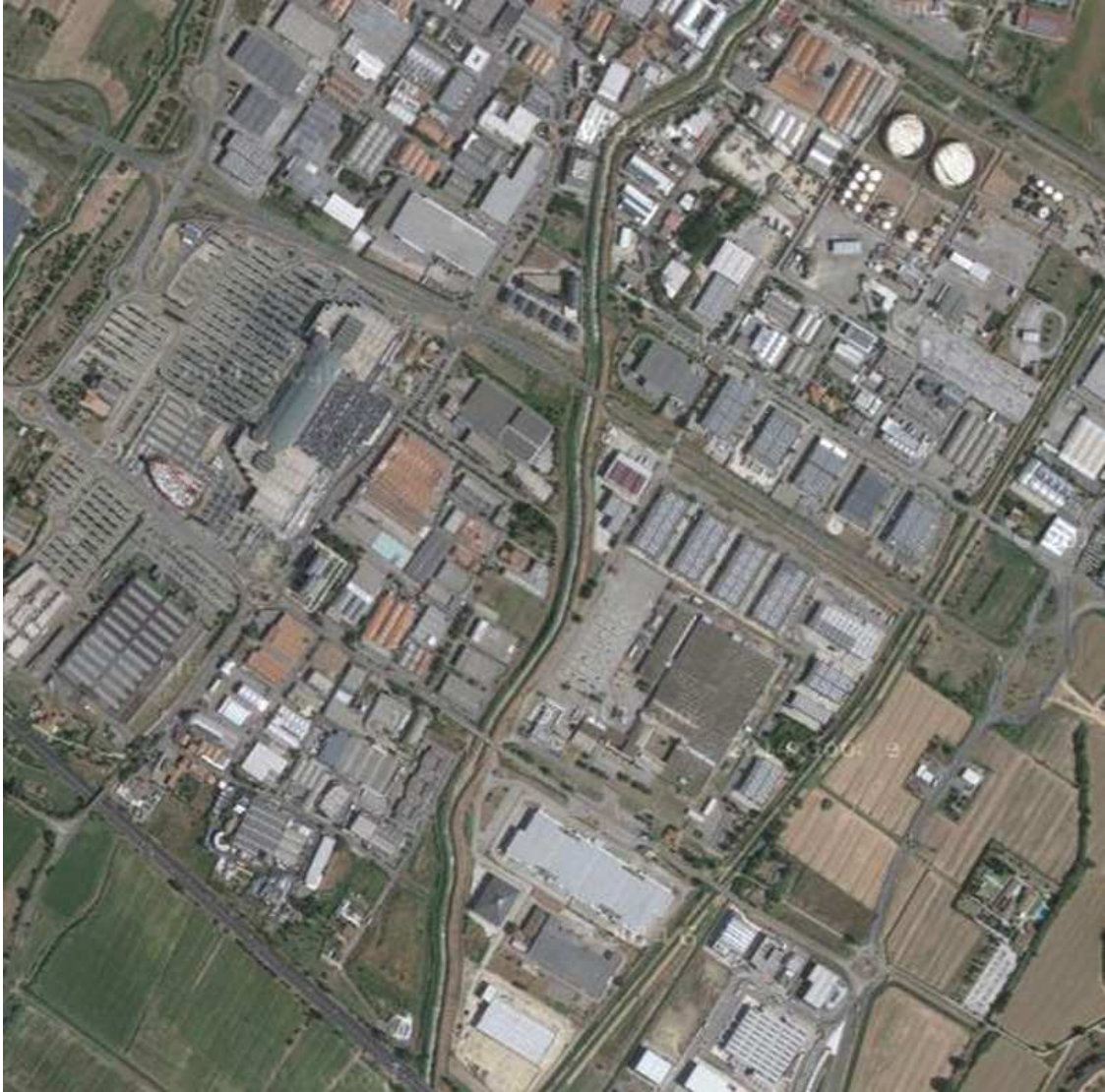
foto area della zona industriale adiacente al torrente Marina