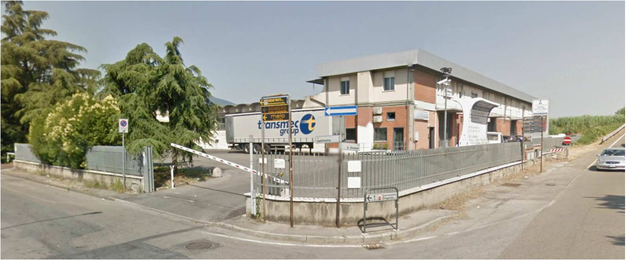
Foto della zona