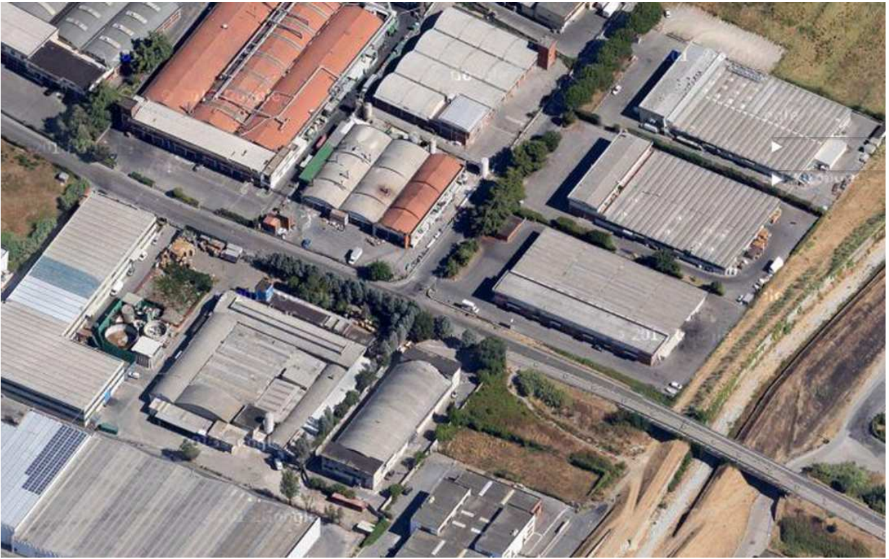
foto aerea di dettaglio